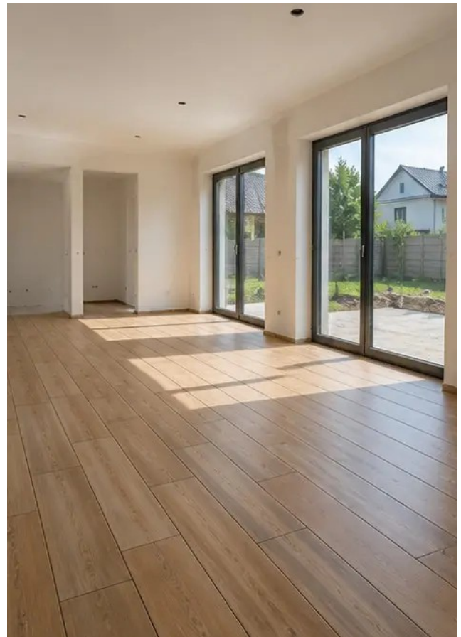
Dokumentacja fotograficzna №12 Układanie podłóg zakończone zgodnie ze specyfikacją projektu