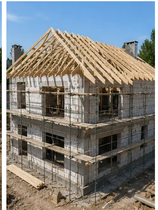
Prace montażowe dachu zakończone