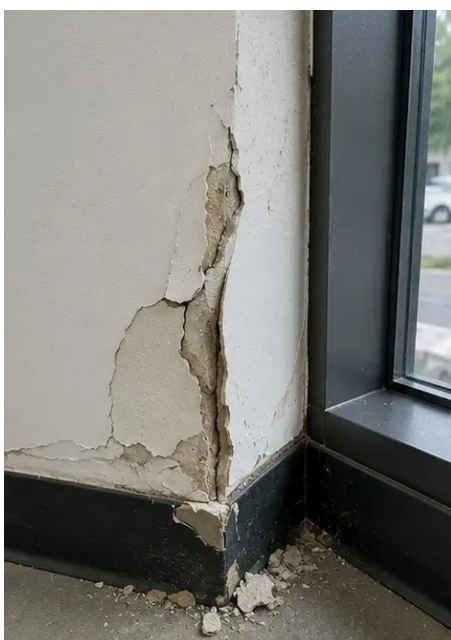
Photo #15. Gesignaleerd gebrek gedocumenteerd voor verdere evaluatie