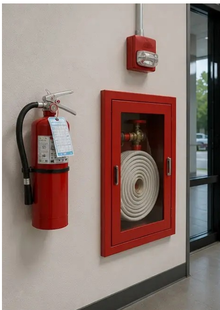
Photo #12. Veiligheidsvoorzieningen geïnspecteerd en geregistreerd