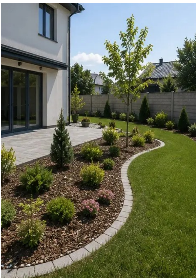
Foto №14 Externe landschapsinrichting rond de installatie voltooid