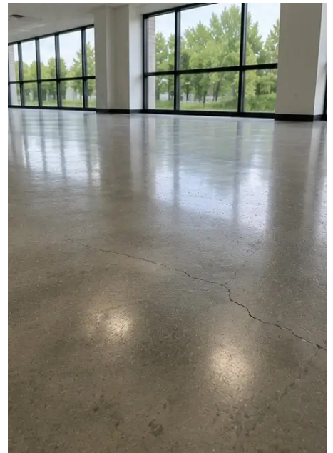
Photo #15. Kawasan kecacatan yang dikenal pasti didokumenkan untuk penilaian lanjut

Photo #14. Keadaan lantai dinilai dan direkodkan