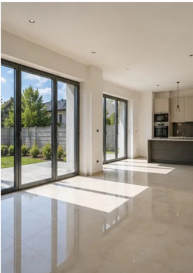
Foto №16 Bahagian dalam bangunan yang siap sedia untuk beroperasi