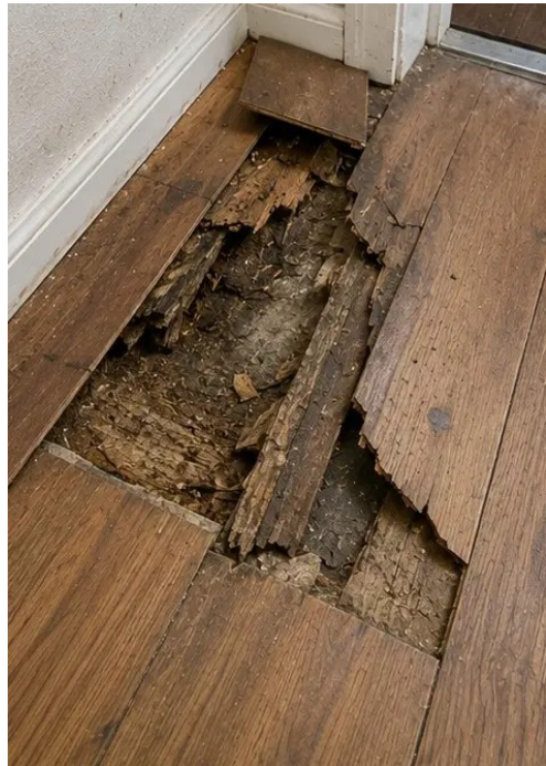
写真 №9 調査中に記録された損傷した床