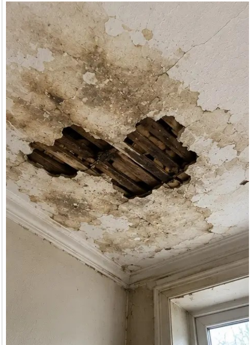
写真 №10 特定され記録された天井損傷