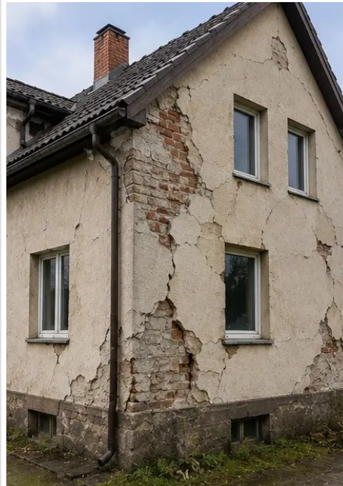
写真 №2 調査中に記録された外部損傷の概要