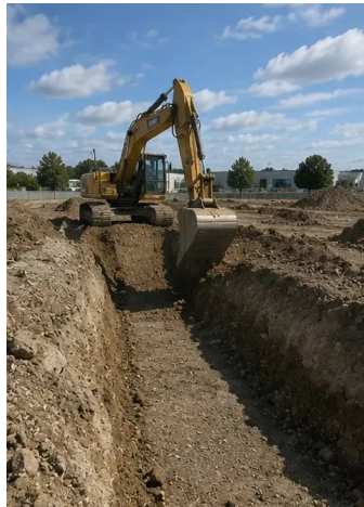
写真 №4. 初期掘削作業完了