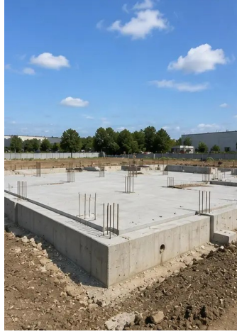
写真 №6. 構造フレーム組立開始