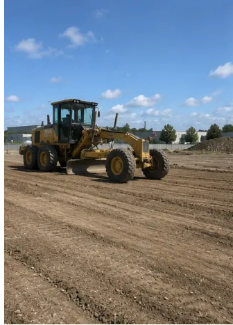
写真 №3. 地盤整地と整地完了