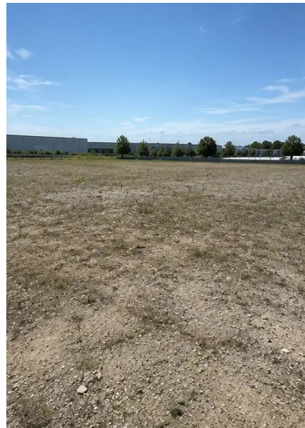
写真 №5. 基礎工事完了