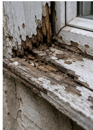
Photo #14. Foto bukti jarak dekat dari kerusakan yang teridentifikasi