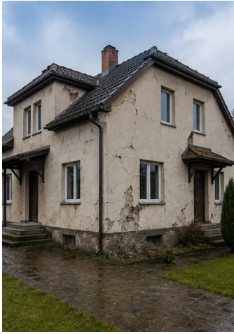
Photo #2. Gambaran kerusakan eksterior yang didokumentasikan selama inspeksi