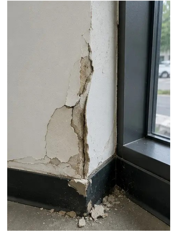
Foto №15 Area cacat yang teridentifikasi didokumentasikan untuk evaluasi lebih lanjut