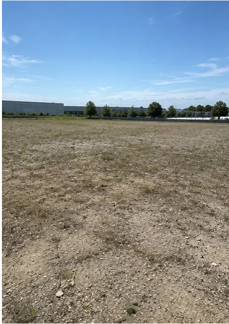
Fotó №1. A projekt helyszíne a munkák megkezdése előtt