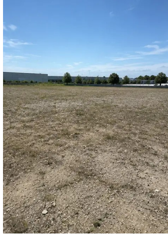
Fotó №1. A projekt helyszíne a munkák megkezdése előtt