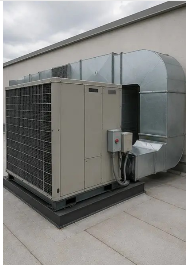
Fotografija br.11 Stanje HVAC opreme procijenjeno