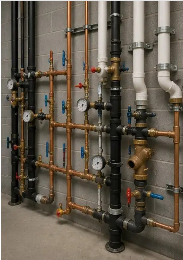
Fotografija br.10 Pregled vodoinstalaterskog sustava dovršen