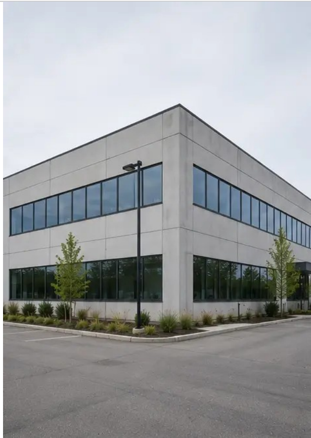
Fotografija br.1 Opći pregled pregledane nekretnine