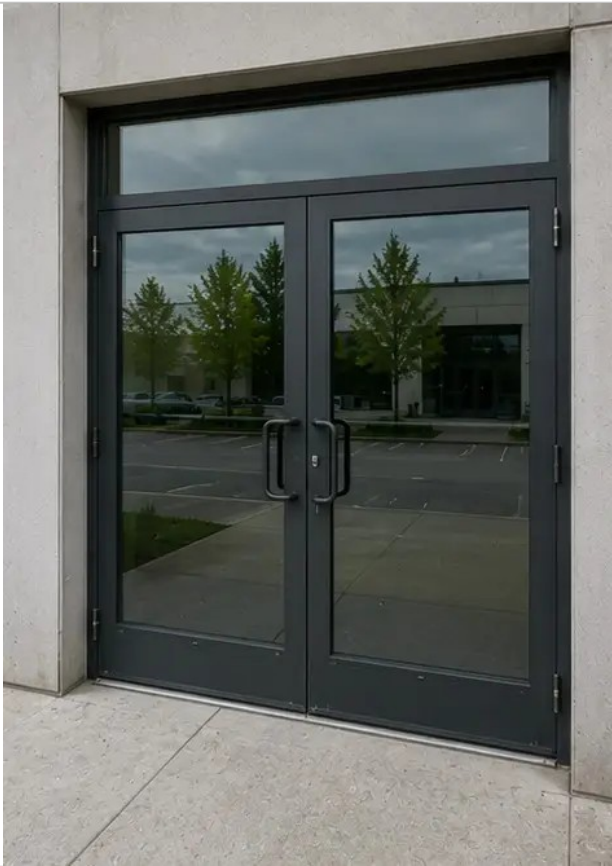
Fotografija br.7 Stanje vrata pregledano i zabilježeno