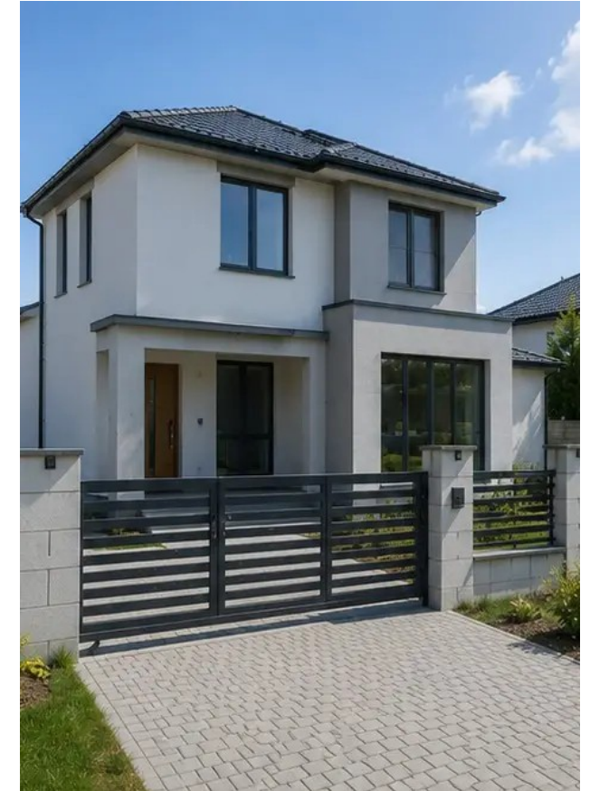
Fotografija br.15 Dovršena vanjština zgrade nakon izgradnje