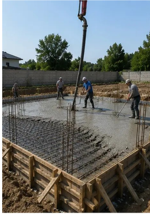
Fotografija br.5 Betoniranje izvedeno na temeljnim elementima