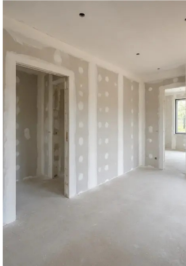
Fotografija br.11 Radovi na završnoj obradi unutarnjih zidova u tijeku