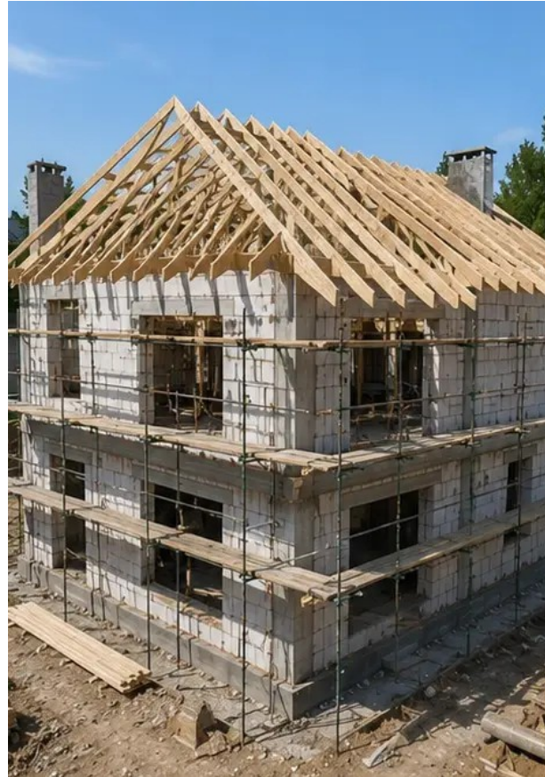
Fotografija br.8 Radovi na postavljanju krova završeni