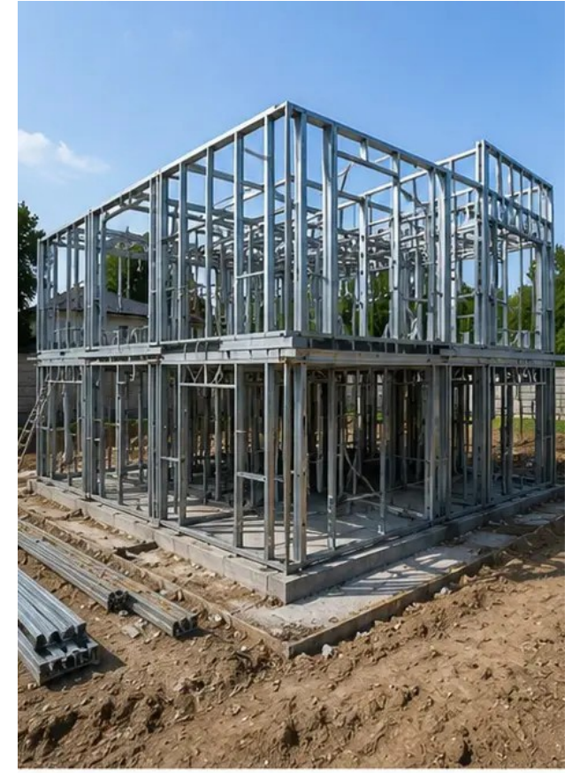
Fotografija br.6 Montaža nosive konstrukcije u tijeku