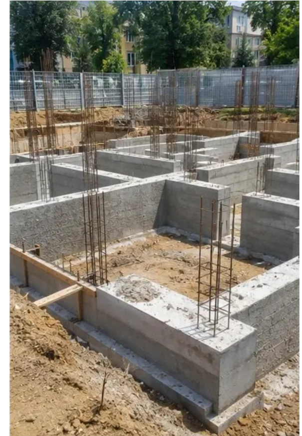
Fotografija br.3 Izgradnja temelja u tijeku