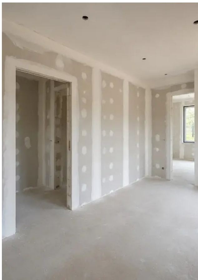
Fotografija br.11 Radovi na završnoj obradi unutarnjih zidova u tijeku