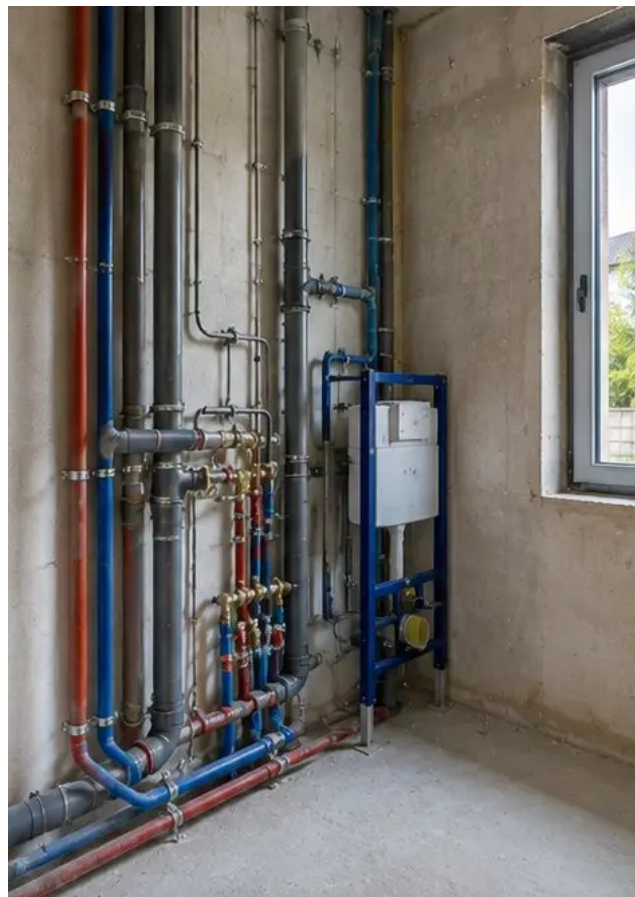
Fotografija br.10 Instalacija vodoinstalaterskih sustava završena u određenim područjima