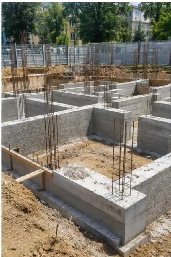
Fotografija br.3 Izgradnja temelja u tijeku