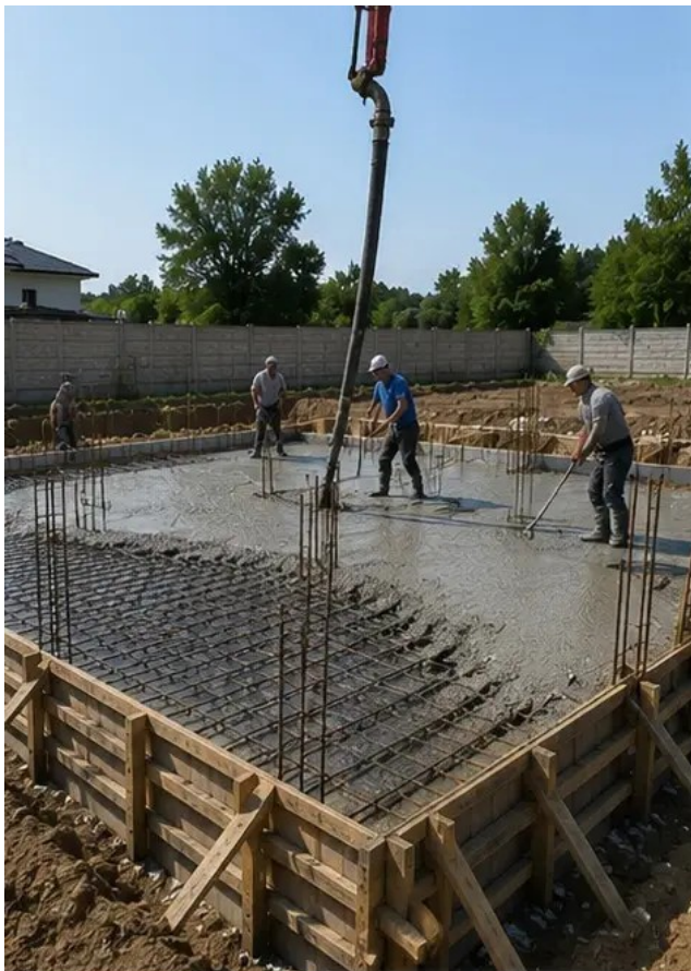
Fotografija br.5 Betoniranje izvedeno na temeljnim elementima