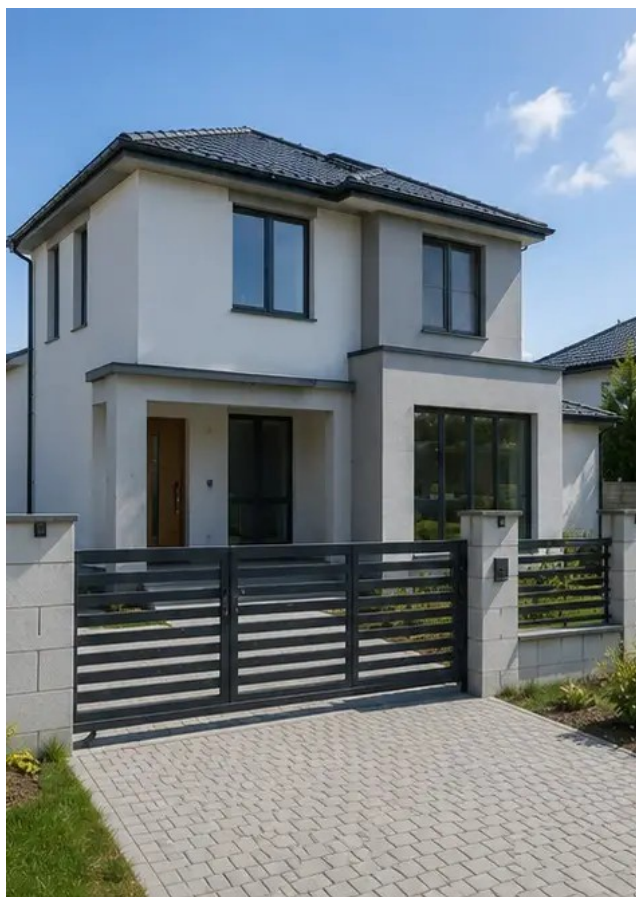
Fotografija br.15 Dovršena vanjšina zgrade nakon izgradnje