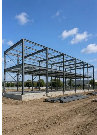
Fotografija br.7. Izgradnja nosive konstrukcije u tijeku