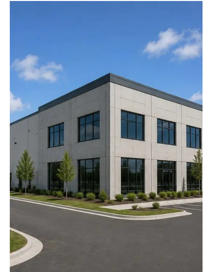
Fotografija br.16. Dovršeni projekt spreman za rad