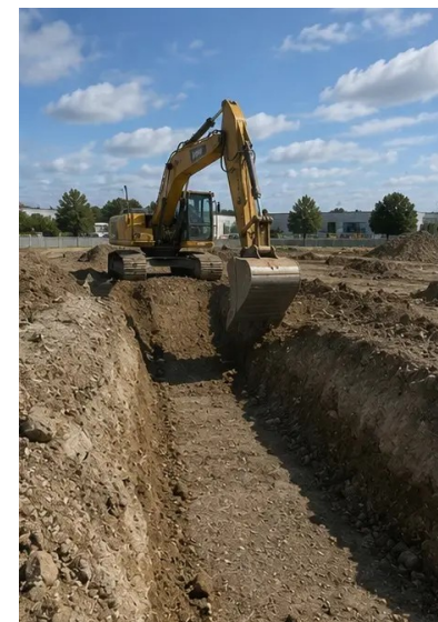
Fotografija br.4. Početni iskopi dovršeni