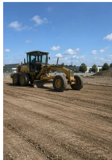
Fotografija br.3. Čišćenje i ravnanje terena dovršeno