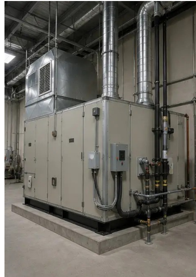
Fotografija br.14. Instalacija opreme dovršena