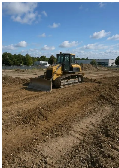
Fotografija br.2. Aktivnosti pripreme gradilišta u tijeku