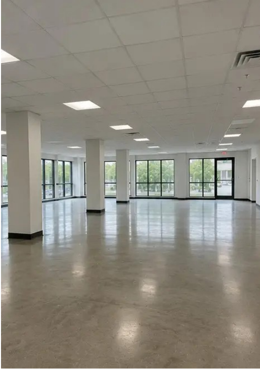
फोटो №16 निरीक्षण की गई संपत्ति का अंतिम अवलोकन