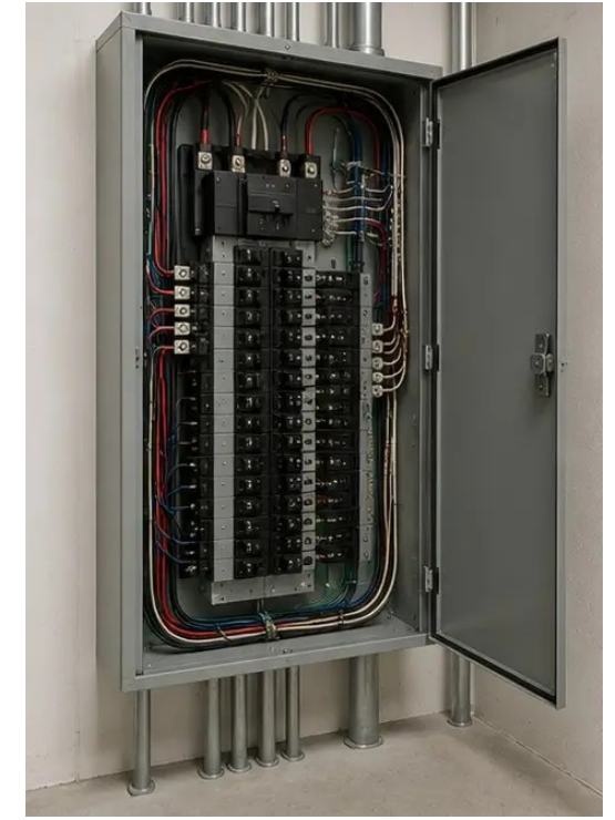
फोटो №9 विद्युत पैनल की स्थिति दस्तावेजित