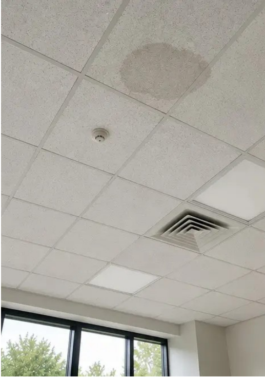
फोटो №13 निरीक्षण के दौरान दस्तावेजित छत की स्थिति