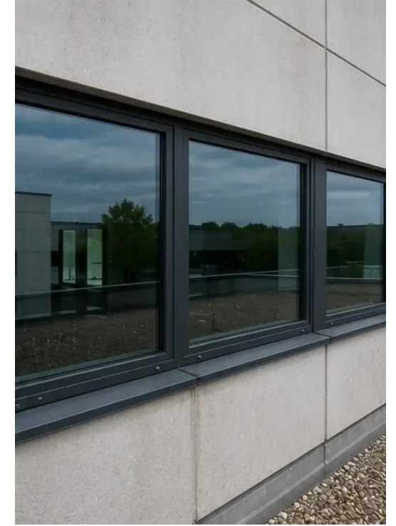
फोटो №6 निरीक्षण के दौरान दस्तावेजित खिड़कियों की स्थिति