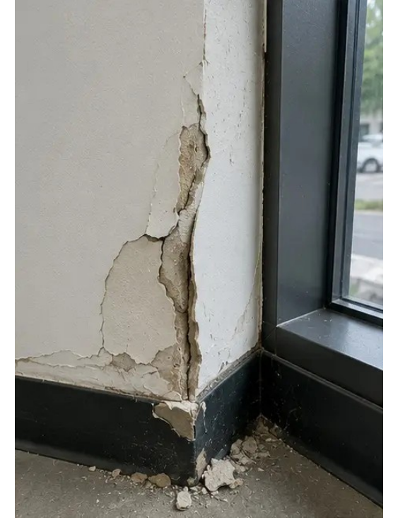
फोटो №15 आगे के मूल्यांकन के लिए पहचाना गया दोष क्षेत्र दस्तावेजित