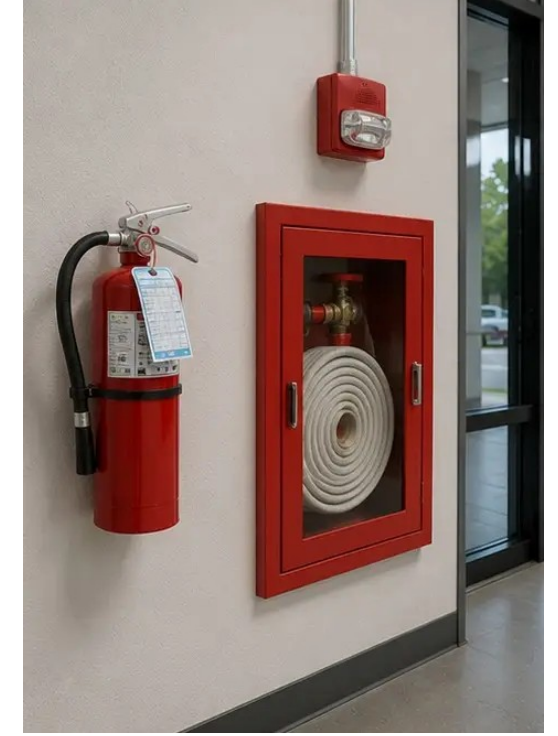
फोटो №12 सुरक्षा उपकरण का निरीक्षण और रिकॉर्ड