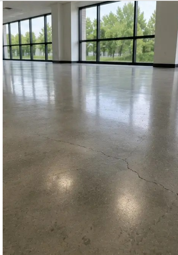
Photo n°15 Zone de défaut identifiée documentée pour évaluation ultérieure