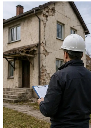
Photo #16. Photographie de synthèse finale de l'inspection des dommages