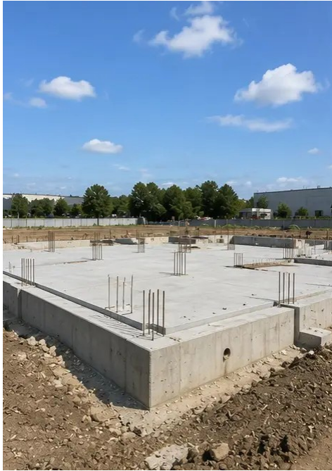
Kuva №5. Perustusten rakentaminen valmis