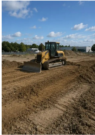
Foto No2. Actividades de preparación del sitio en curso