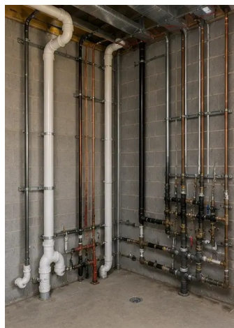
Foto No12. Instalación de sistemas de plomería completada