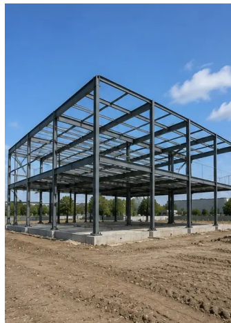
Foto Nº8. Estructura portante completada según el cronograma del proyecto