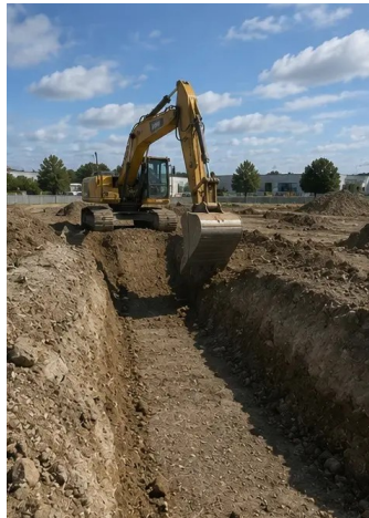
Foto No4. Trabajos iniciales de excavación completados