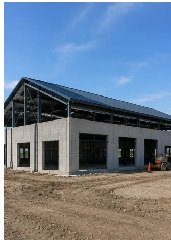
Foto No10. Construcción del techo completada