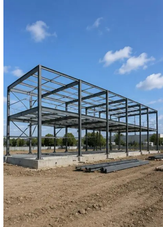
Foto Nº7. Construcción de la estructura portante en curso