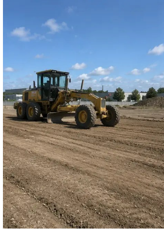
Foto No3. Limpieza y nivelación del terreno completadas