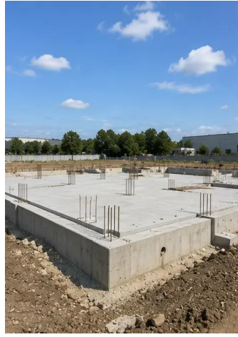
Foto Nº5. Construcción de la cimentación completada