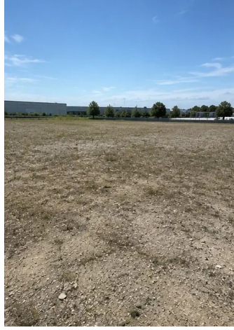
Foto No1. Sitio del proyecto antes del inicio de los trabajos