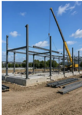
Foto Nº6. Montaje de la estructura portante iniciado