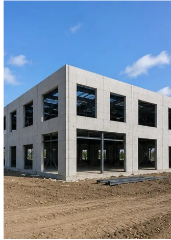
Foto No9. Estructura portante completada según el cronograma del proyecto