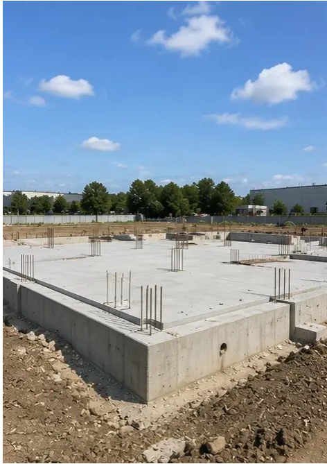
Foto No5. Construcción de la cimentación completada