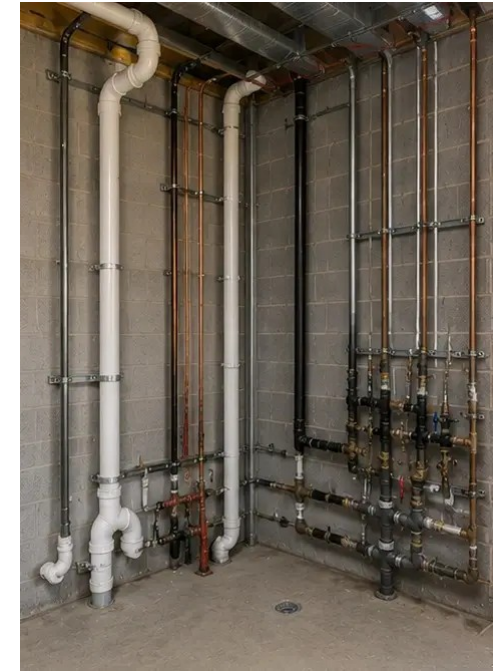
Foto No12. Instalación de sistemas de plomería completada