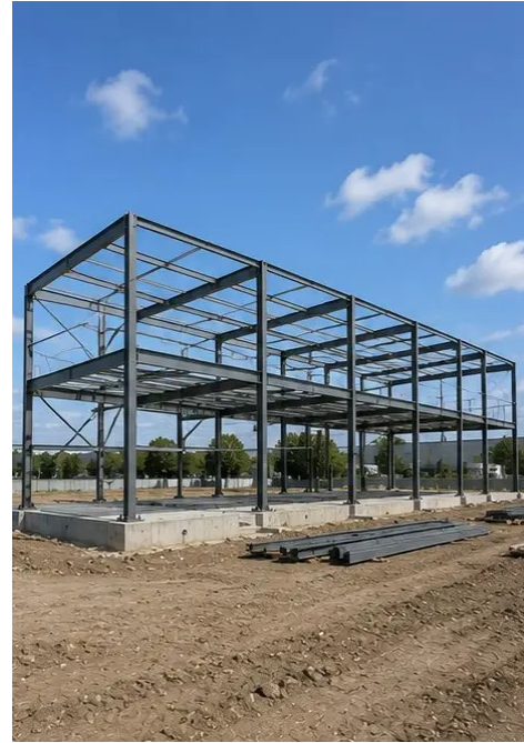
Foto No7. Construcción de la estructura portante en curso