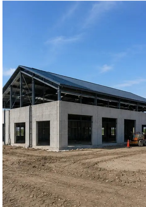
Foto No10. Construcción del techo completada