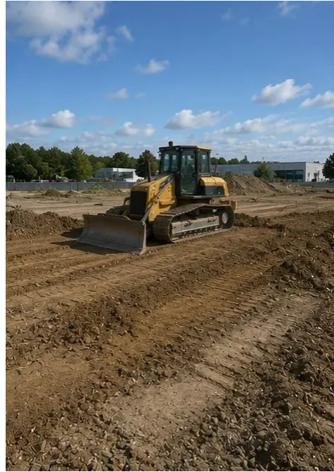
Foto No2. Actividades de preparación del sitio en curso