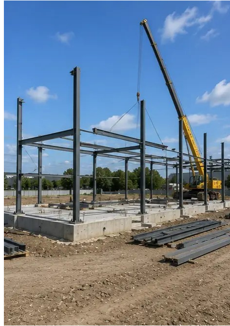
Foto No6. Montaje de la estructura portante iniciado