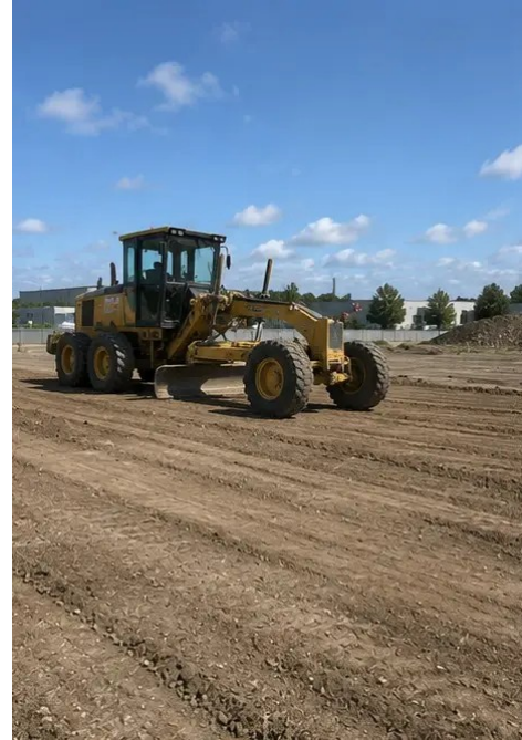
Foto No3. Limpieza y nivelación del terreno completadas