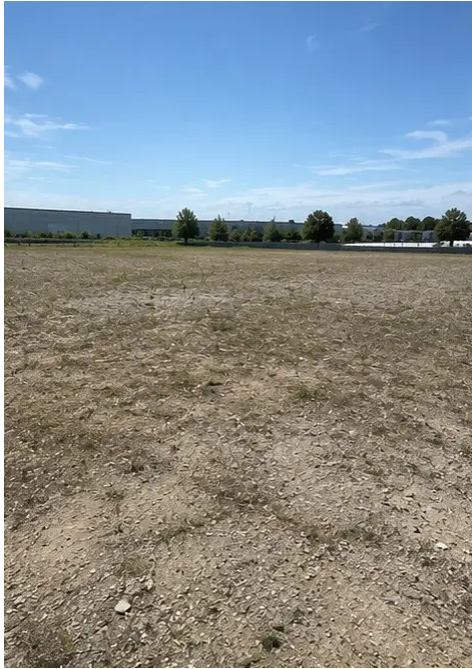
Foto No1. Sitio del proyecto antes del inicio de los trabajos