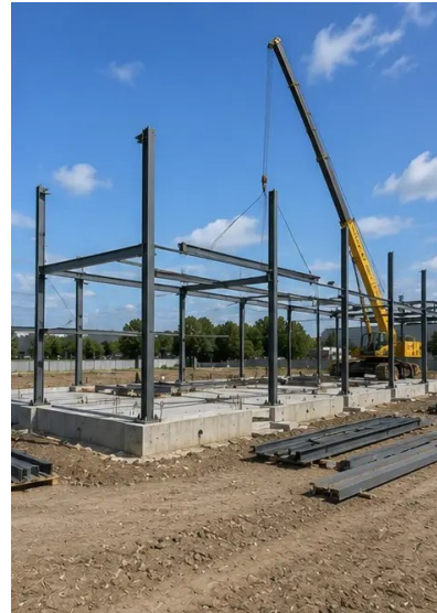
Foto No6. Montaje de la estructura portante iniciado