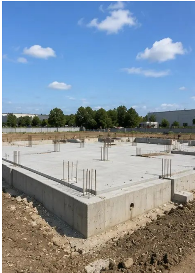
Foto No5. Construcción de la cimentación completada