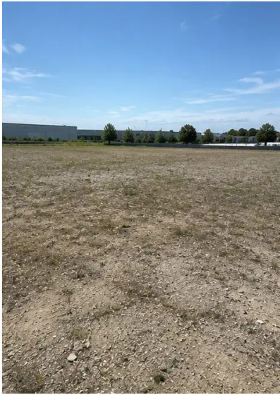
Foto No1. Sitio del proyecto antes del inicio de los trabajos