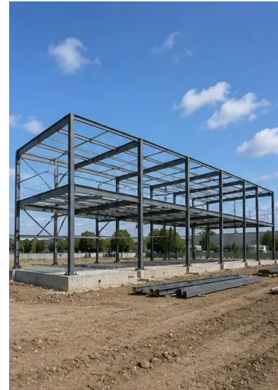
Foto No7. Construcción de la estructura portante en curso