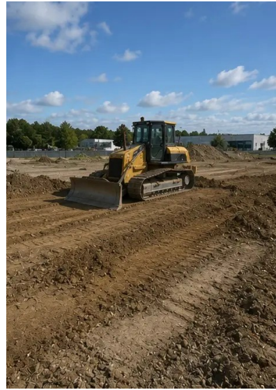
Foto No2. Actividades de preparación del sitio en curso