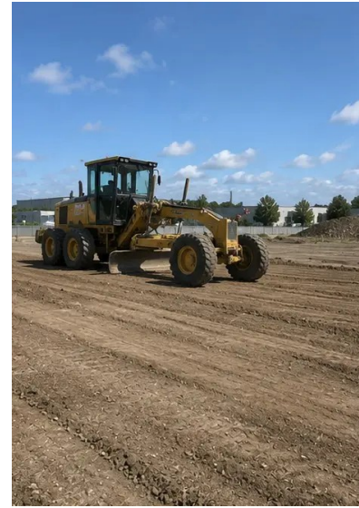
Foto No3. Limpieza y nivelación del terreno completadas