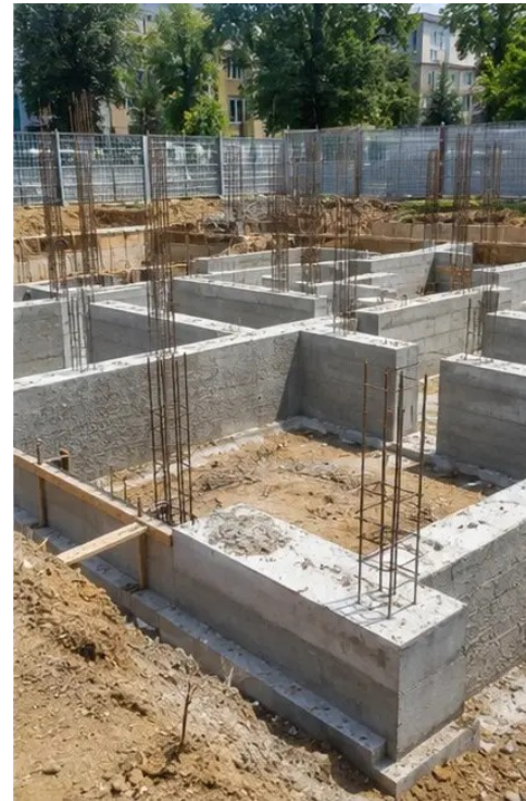
Foto №4 Instalación de refuerzo completada antes del vertido de hormigón

Foto №3 Construcción de la cimentación en curso