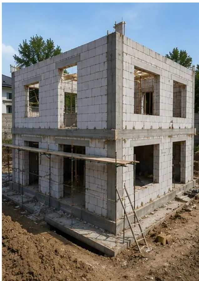
Foto №7 Construcción de muros exteriores completada para la sección del edificio