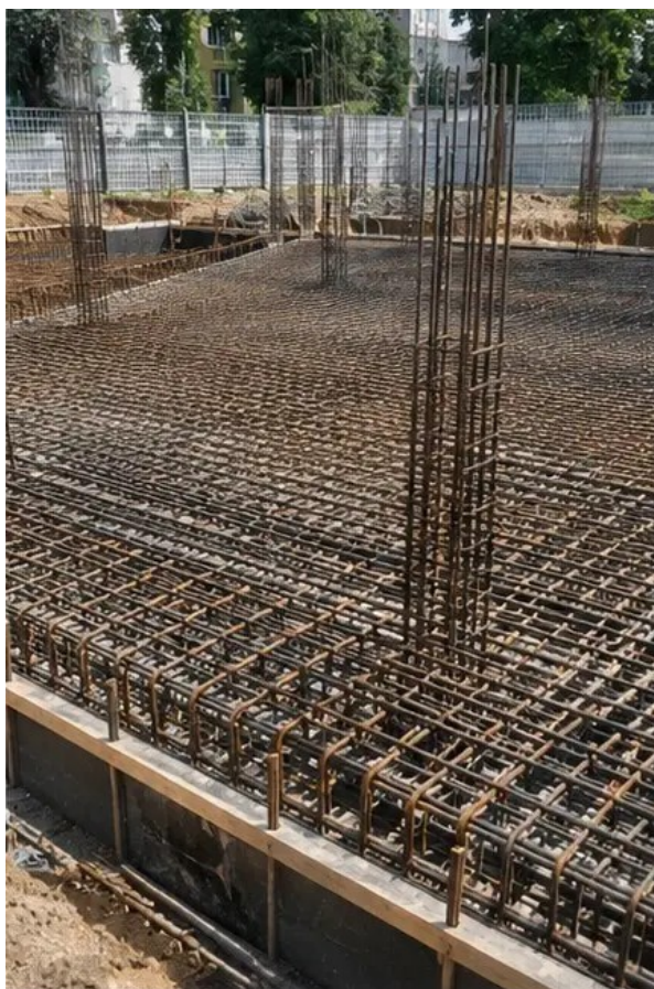
Foto №4 Instalación de refuerzo completada antes del vertido de hormigón