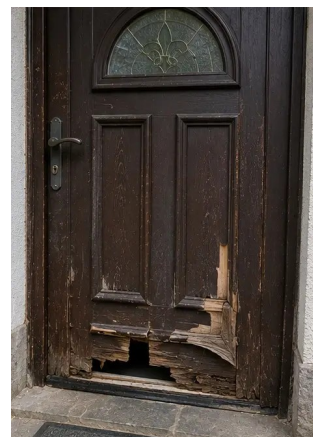
Photo #8. Puerta de entrada dañada registrada durante la inspección