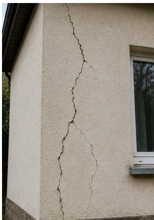
Photo #5. Grieta en pared estructural documentada durante la inspección