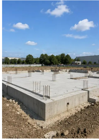
Φωτογραφία Νο5. Κατασκευή θεμελίων ολοκληρώθηκε