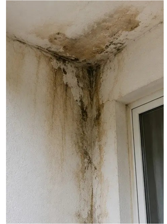
Φωτογραφία Νο6 Περιοχή ζημιάς από νερό προσδιορίστηκε και καταγράφηκε