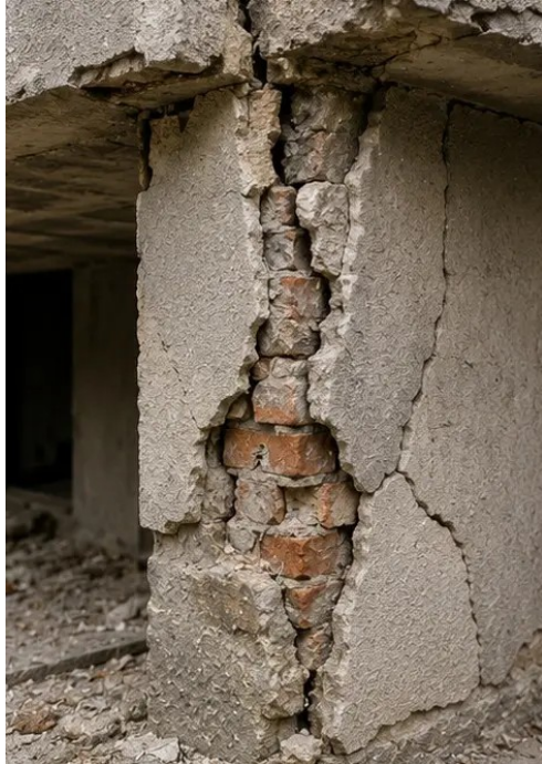
Foto nr.14 Nærbillede af identificeret skade som dokumentation