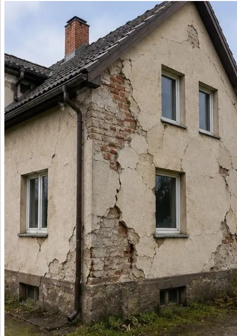
Foto nr.3 Beskadiget tagområde identificeret og registreret