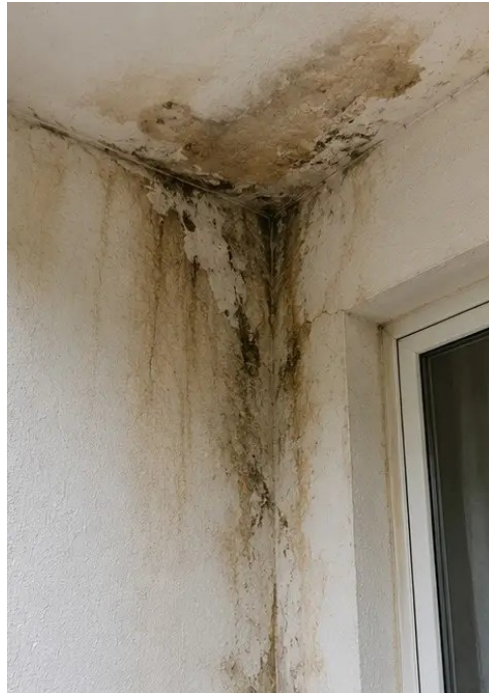
Foto nr.7 Beskadiget vindue dokumenteret til evaluering

Foto nr.6 Vandskadeområde identificeret og registreret