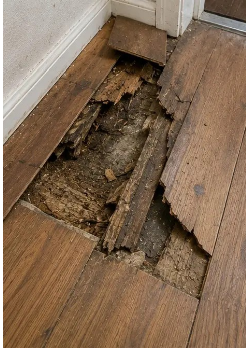
Foto nr.10 Loftskade identificeret og registreret