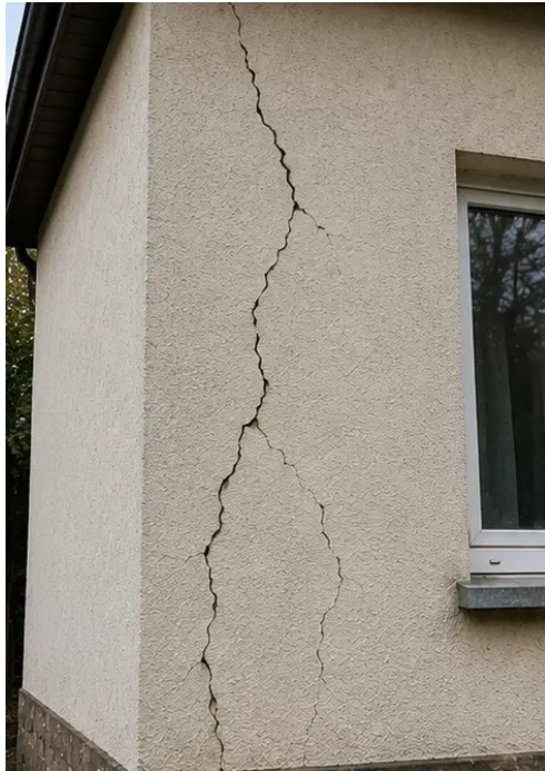
Foto nr.6 Vandskadeområde identificeret og registreret

Foto nr.5 Revne i bærende væg dokumenteret under inspektion