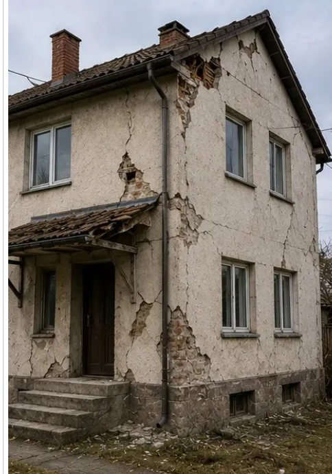
Foto nr.16 Afsluttende oversigtsfoto af skadesinspektion