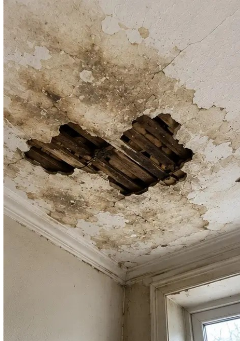
Foto nr.11 VVS-lækageskade dokumenteret