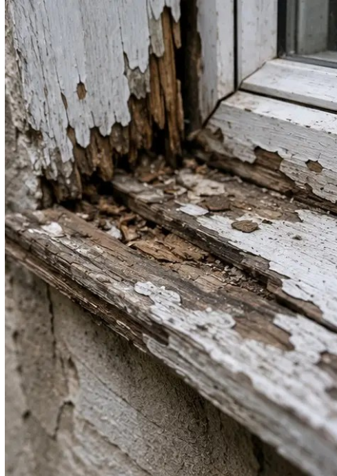
Foto nr.15 Oversigt over flere skadesteder