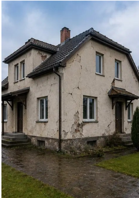
Foto nr.2 Oversigt over udvendige skader dokumenteret under inspektion