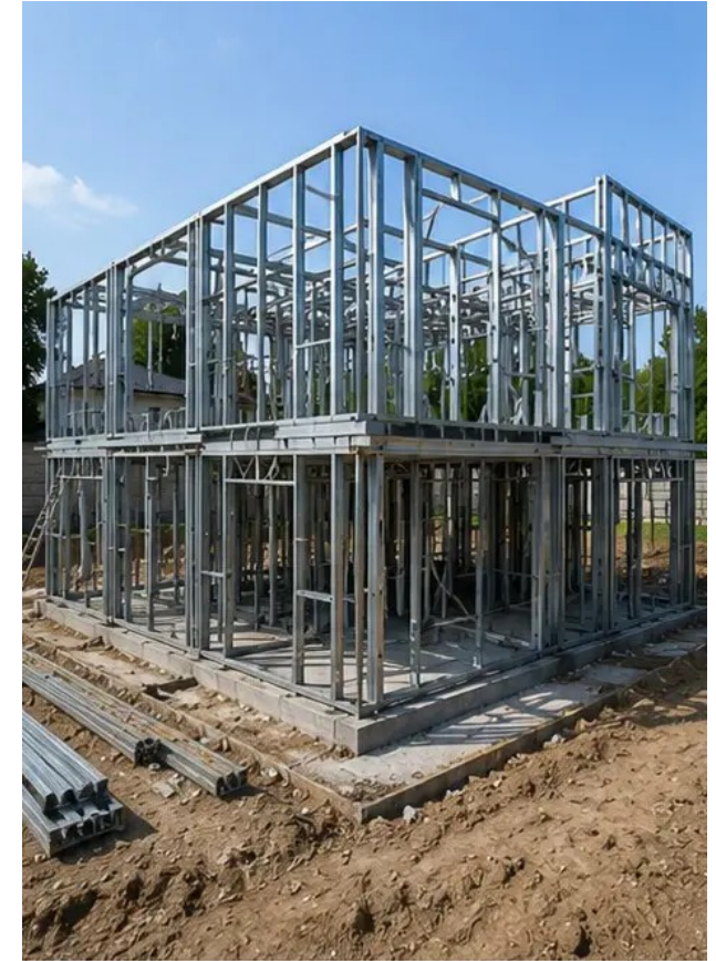
Foto nr.6 Montering af bærende konstruktion i gang