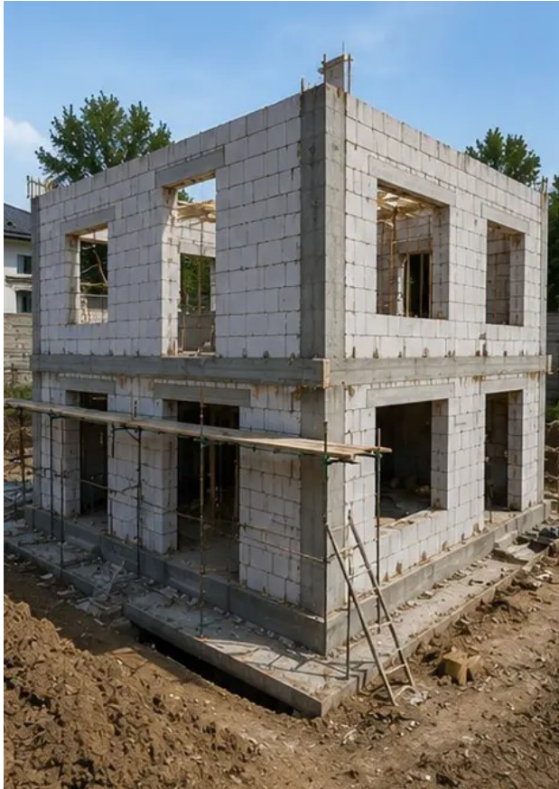
Foto nr.7 Ydervægskonstruktion afsluttet for bygningssektionen