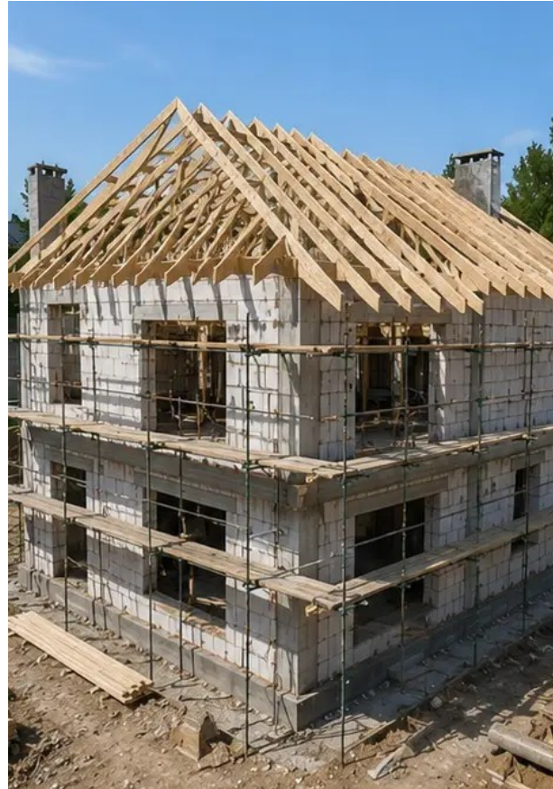
Foto nr.8 Tagmontering afsluttet