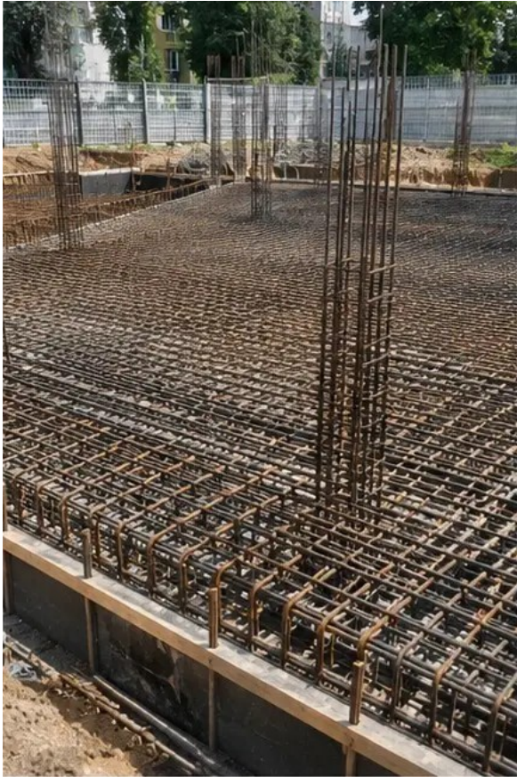
Foto nr.4 Armeringsinstallation afsluttet før betonstøbning