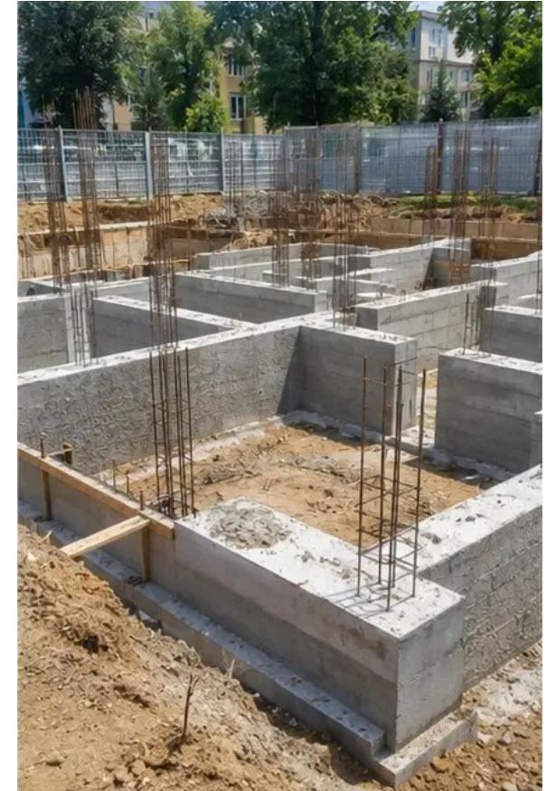
Foto nr.3 Fundamentkonstruktion i gang