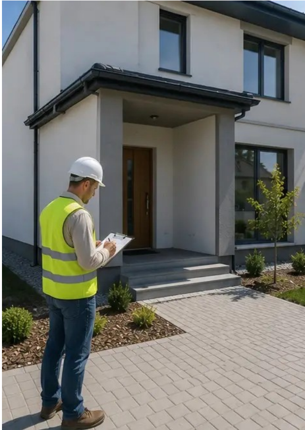
Foto nr.13 Slutinspektion af afsluttede byggearbejder