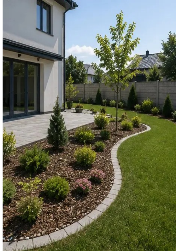
Foto nr.14 Udvendig landskabspleje afsluttet omkring anlægget