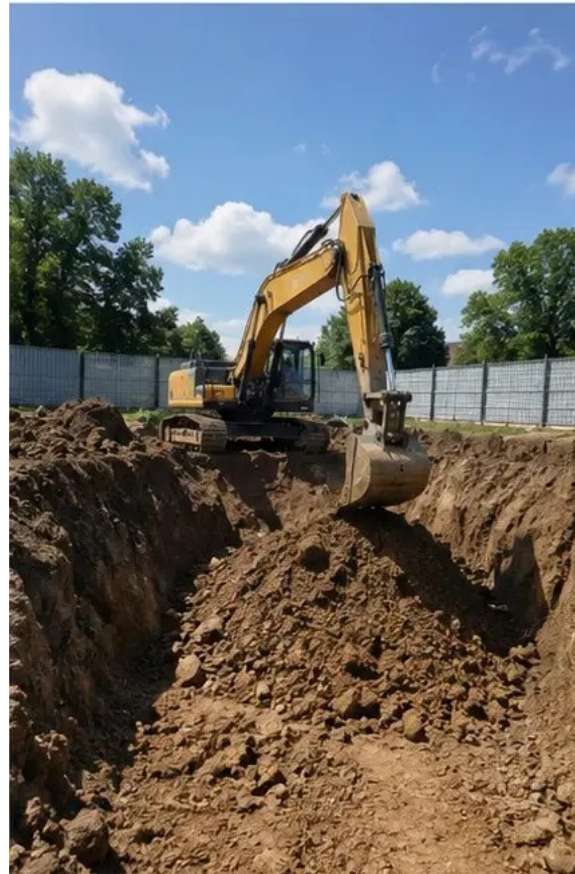
Foto nr.2 Udgravningsarbejde udført i henhold til projektkrav