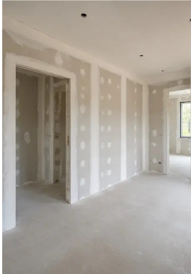
Foto nr.11 Indvendig vægafslutning i gang