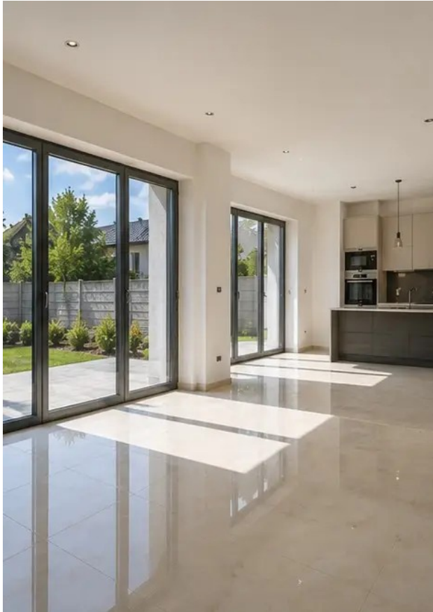
Foto nr.16 Færdigt bygningsinteriør klar til drift