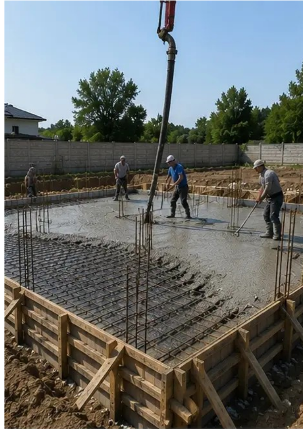
Foto nr.5 Betonstøbning udført på fundamentelementer