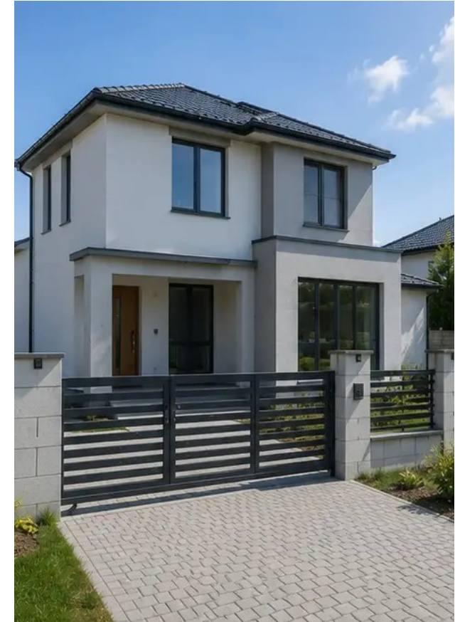
Foto nr.15 Færdig bygningseksteriør efter byggeri