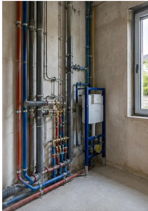
Foto nr.11 Indvendig vægafslutning i gang