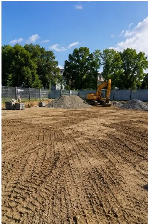
Foto nr.2 Udgravningsarbejde udført i henhold til projektkrav