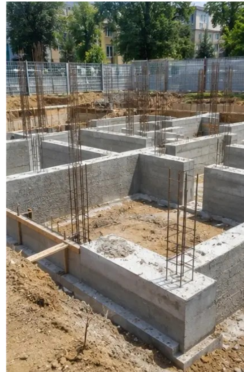
Foto nr.4 Armeringsinstallation afsluttet før betonstøbning