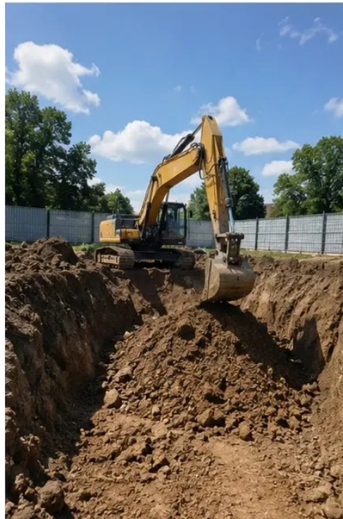
Foto nr.3 Fundamentkonstruktion i gang