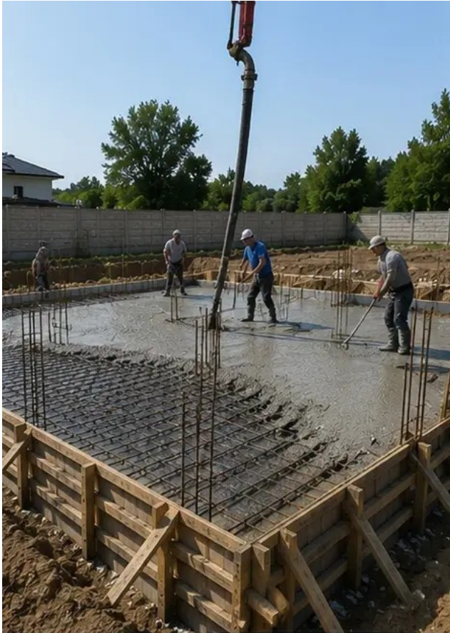
Foto nr.5 Betonstøbning udført på fundamentelementer