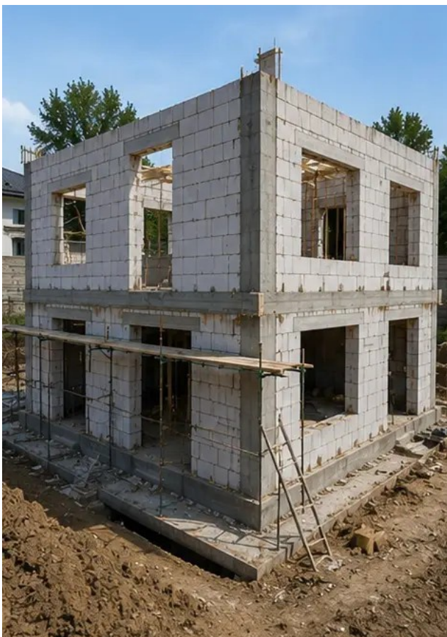
Foto nr.7 Ydervægskonstruktion afsluttet for bygningssektionen