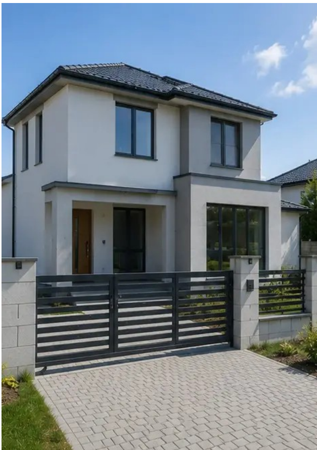
Foto nr.15 Færdig bygningseksteriør efter byggeri