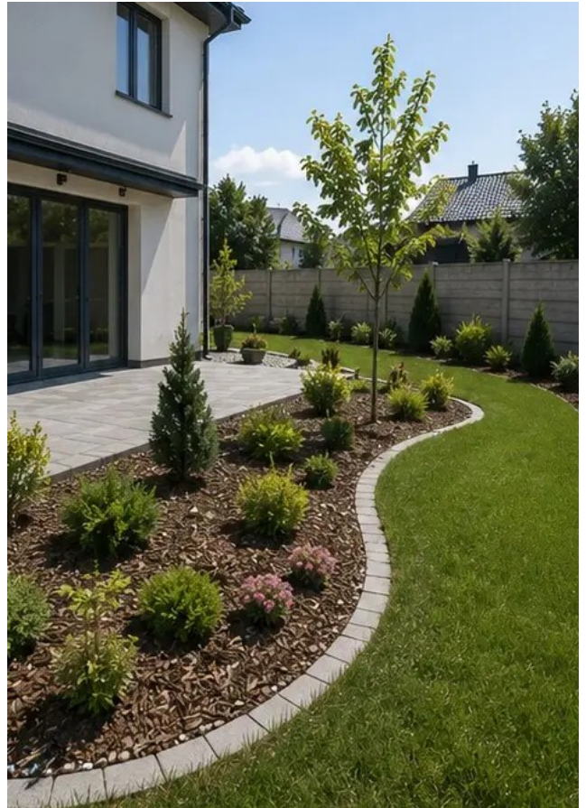
Foto nr.14 Udvendig landskabspleje afsluttet omkring anlægget