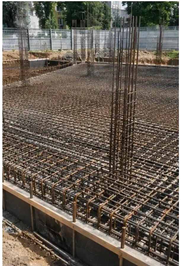
Foto nr.4 Armeringsinstallation afsluttet før betonstøbning