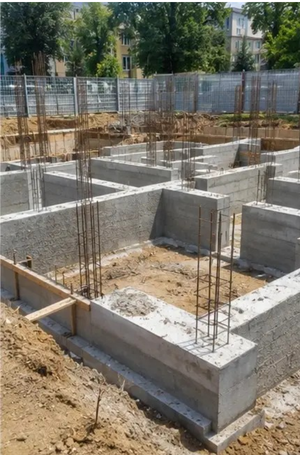
Foto nr.3 Fundamentkonstruktion i gang