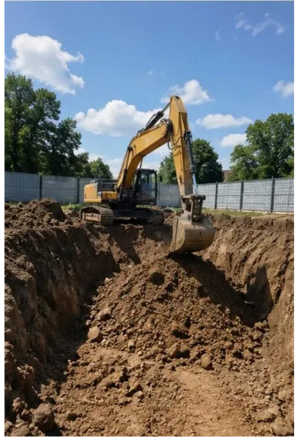
Foto nr.2 Udgravningsarbejde udført i henhold til projektkrav