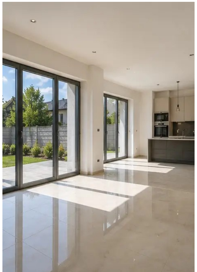
Foto nr.16 Færdigt bygningsinteriør klar til drift