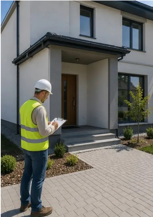
Foto nr.13 Slutinspektion af afsluttede byggearbejder