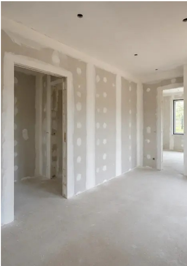
Foto nr.11 Indvendig vægafslutning i gang