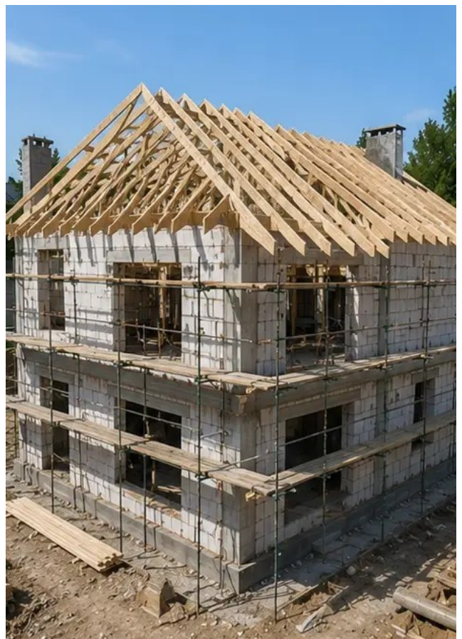
Foto nr.8 Tagmontering afsluttet