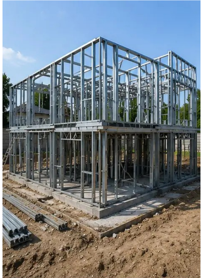
Foto nr.6 Montering af bærende konstruktion i gang