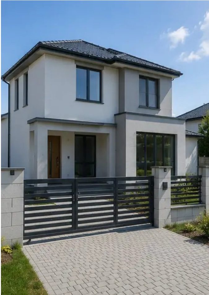
Foto nr.15 Færdig bygningseksteriør efter byggeri