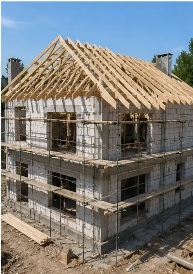
Foto nr.8 Tagmontering afsluttet