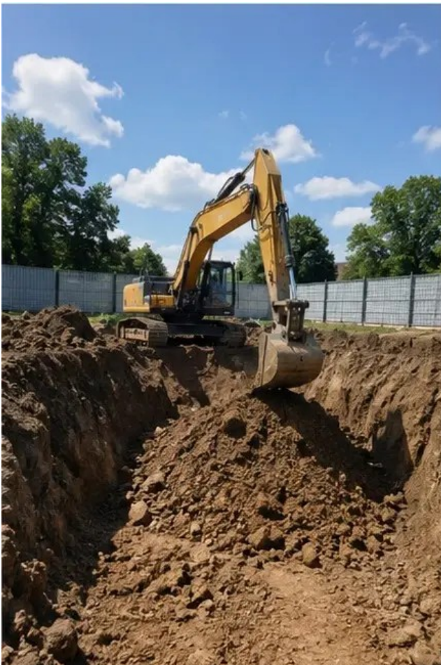
Foto nr.2 Udgravningsarbejde udført i henhold til projektkrav