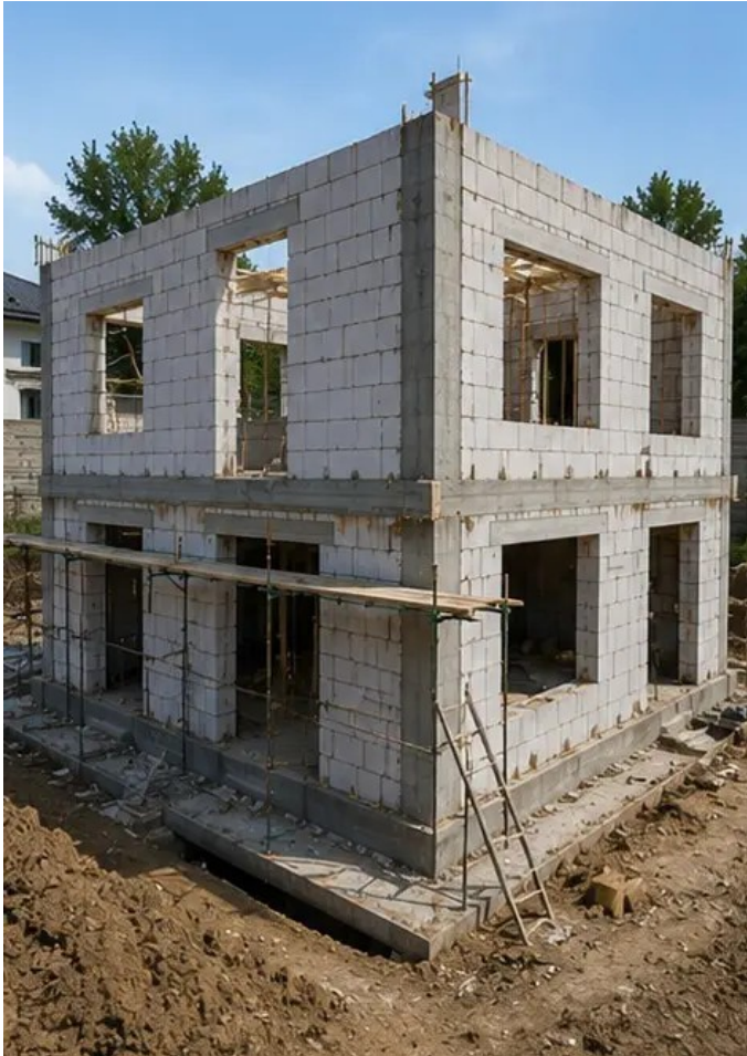
Foto nr.7 Ydervægskonstruktion afsluttet for bygningssektionen