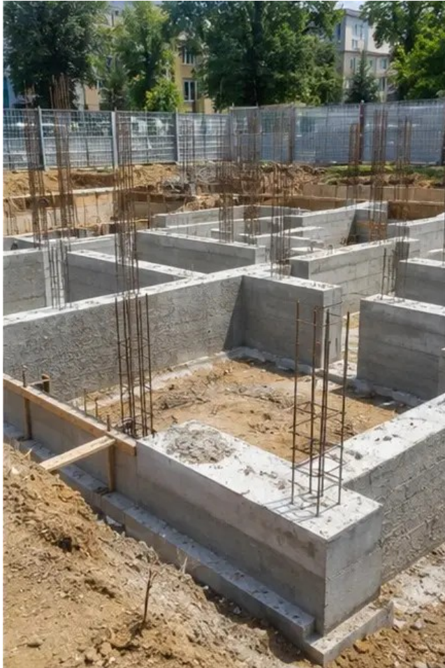
Foto nr.4 Armeringsinstallation afsluttet før betonstøbning