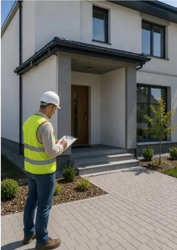
Foto nr.13 Slutinspektion af afsluttede byggearbejder