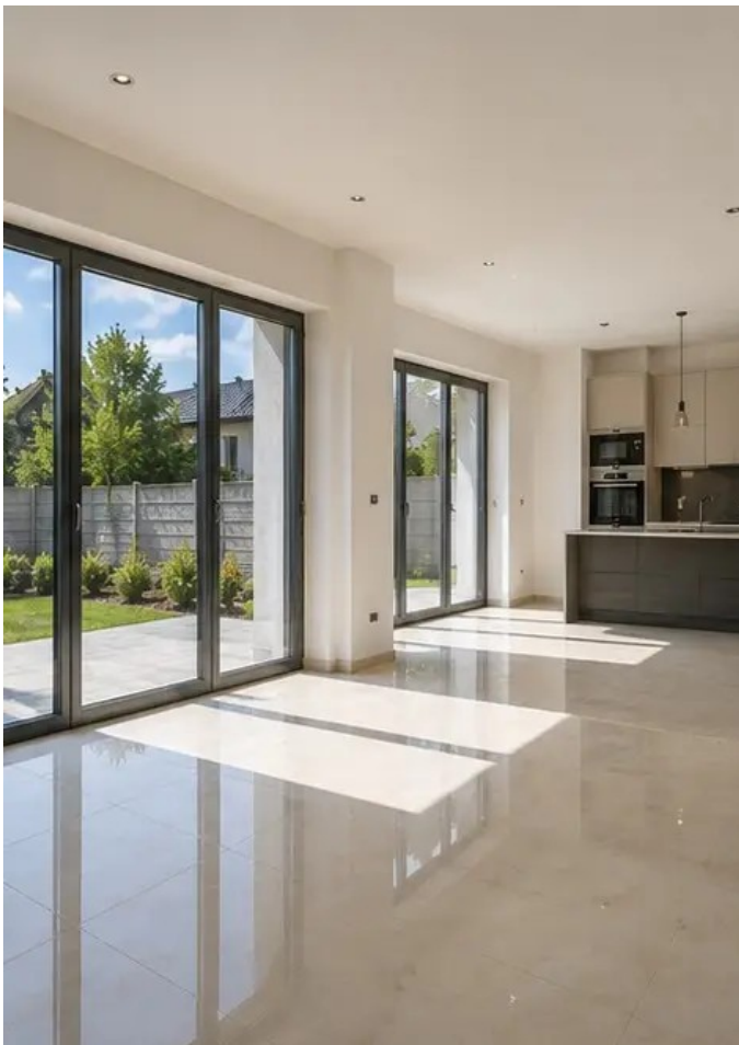
Foto nr.16 Færdigt bygningsinteriør klar til drift