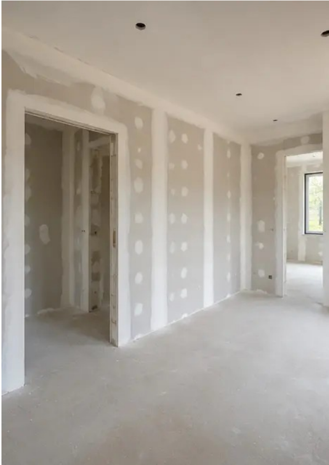
Foto nr.11 Indvendig vægafslutning i gang