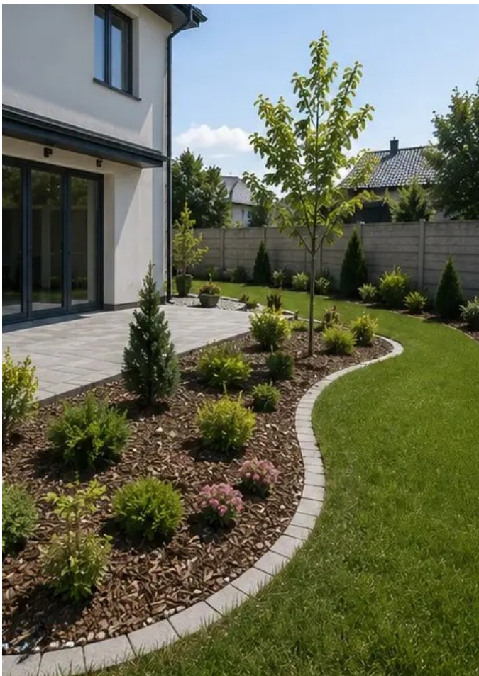
Foto nr.14 Udvendig landskabspleje afsluttet omkring anlægget