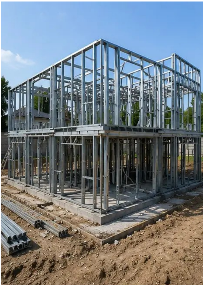
Foto nr.6 Montering af bærende konstruktion i gang