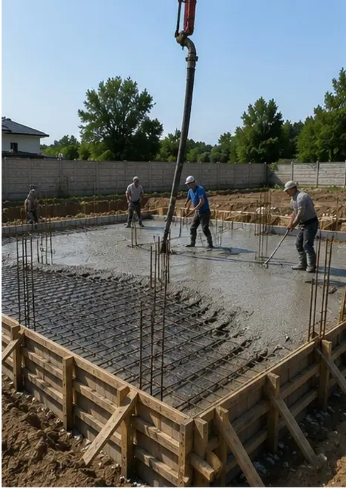
Foto nr.5 Betonstøbning udført på fundamentelementer