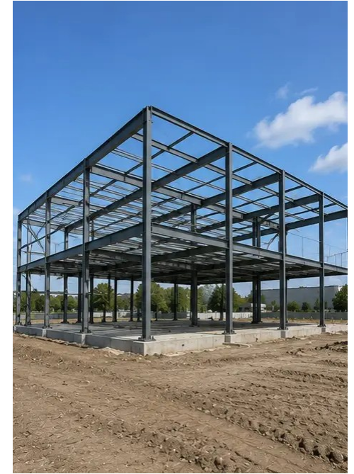
Foto nr.8. Bærende konstruktion afsluttet i henhold til tidsplan