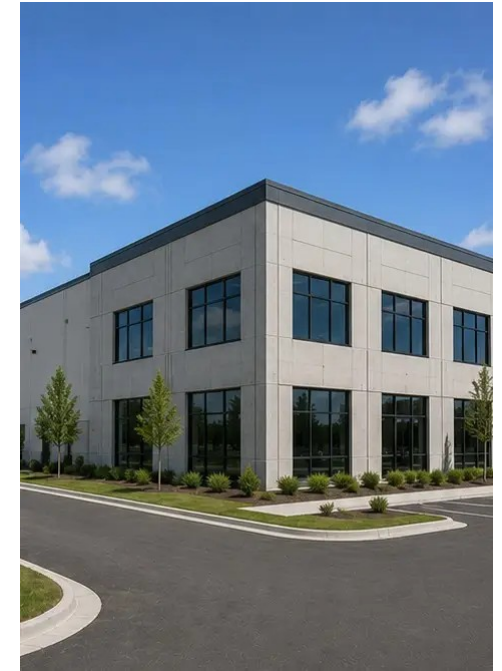
Foto nr.16. Afsluttet projekt klar til drift