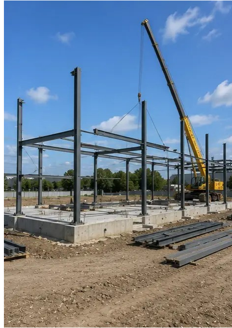
Foto nr.6. Montering af bærende konstruktion påbegyndt