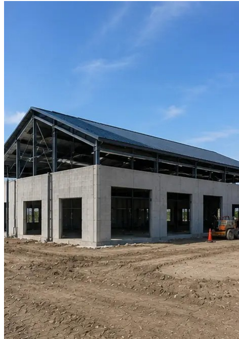
Foto nr.10. Tagkonstruktion afsluttet