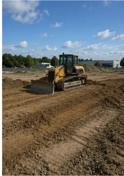
Foto nr.2. Forberedende aktiviteter på pladsen i gang