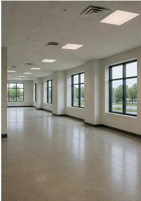
Foto nr.13. Indvendigt afslutningsarbejde i gang