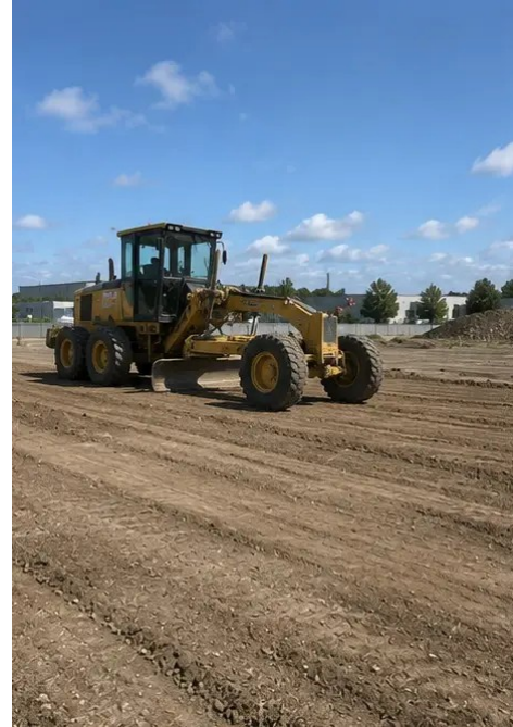
Foto nr.3. Rydning og planering af terræn afsluttet