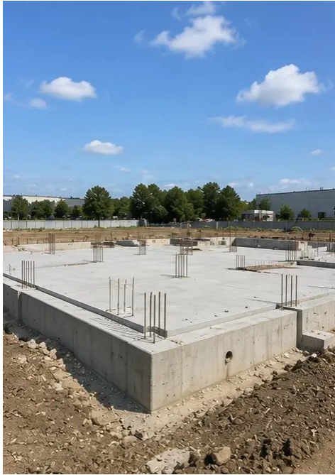
Foto nr.5. Fundamentkonstruktion afsluttet