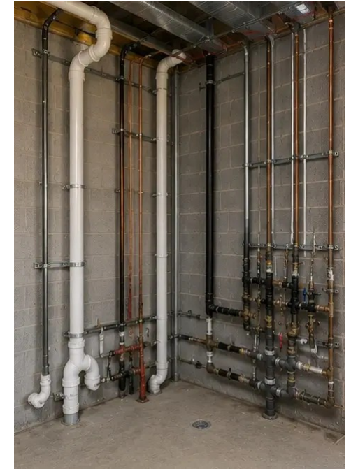
Foto nr.12. VVS-installation afsluttet