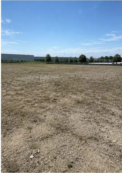
Foto nr.1. Projektsted før arbejdets påbegyndelse