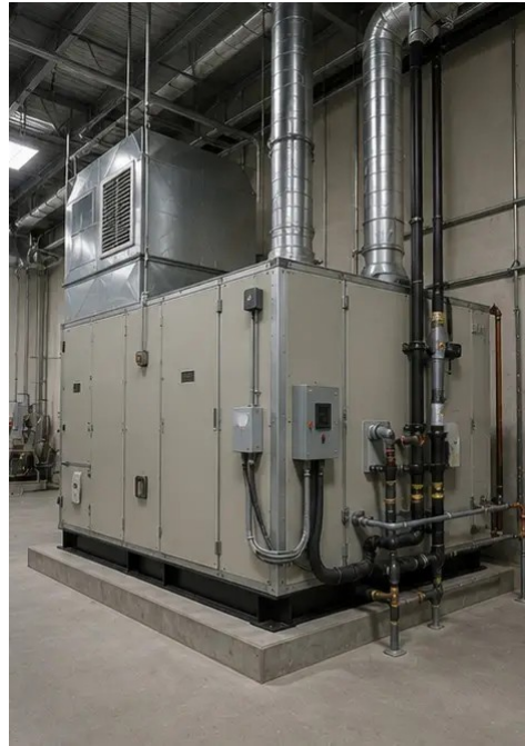
Foto nr.14. Udstyrsinstallation afsluttet