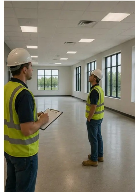
Foto nr.15. Afsluttende projektinspektion gennemført