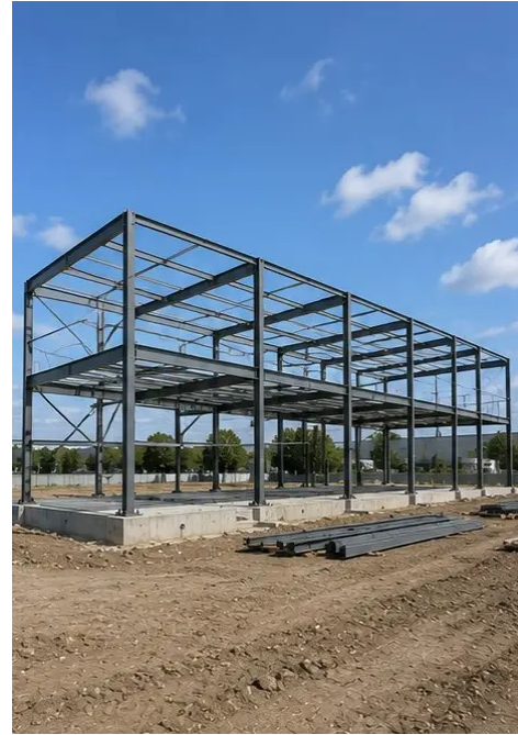
Foto nr.7. Opførelse af bærende konstruktion i gang