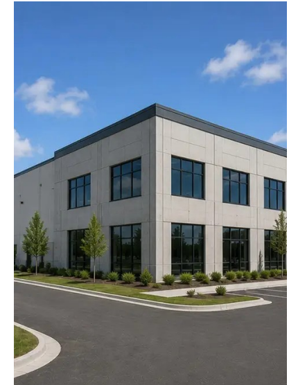
Foto nr.16. Afsluttet projekt klar til drift