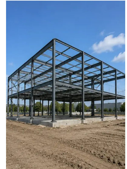
Foto nr.8. Bærende konstruktion afsluttet i henhold til tidsplan