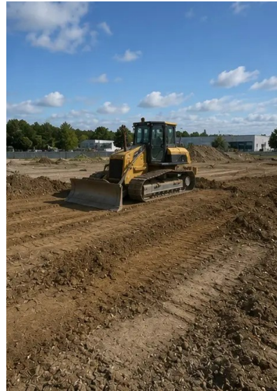
Foto nr.2. Forberedende aktiviteter på pladsen i gang