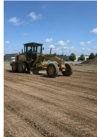
Foto nr.3. Rydning og planering af terræn afsluttet