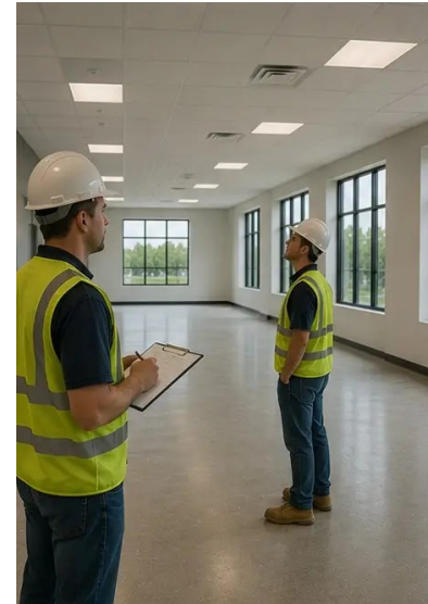
Foto nr.15. Afsluttende projektinspektion gennemført