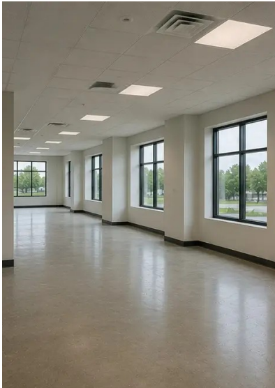
Foto nr.13. Indvendigt afslutningsarbejde i gang