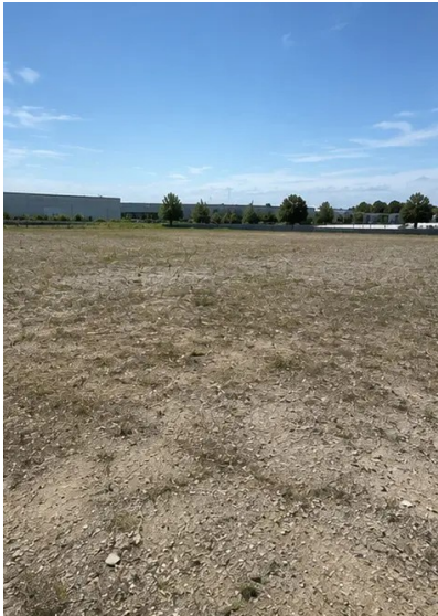
Foto nr.1. Projektsted før arbejdets påbegyndelse