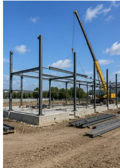
Foto nr.6. Montering af bærende konstruktion påbegyndt