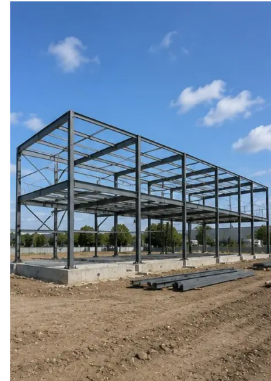
Foto nr.7. Opførelse af bærende konstruktion i gang