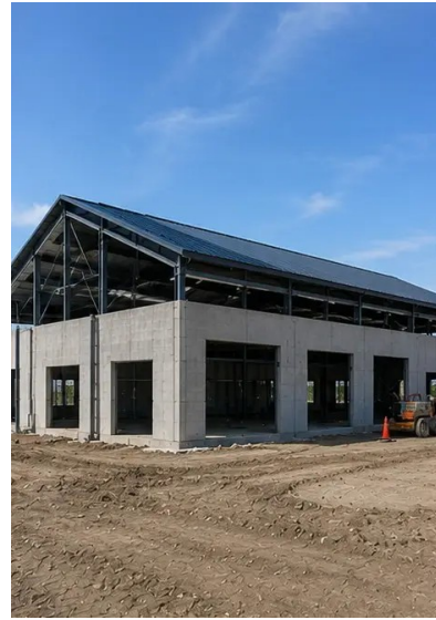
Foto nr.10. Tagkonstruktion afsluttet