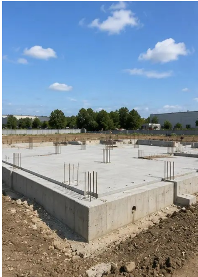
Foto nr.5. Fundamentkonstruktion afsluttet