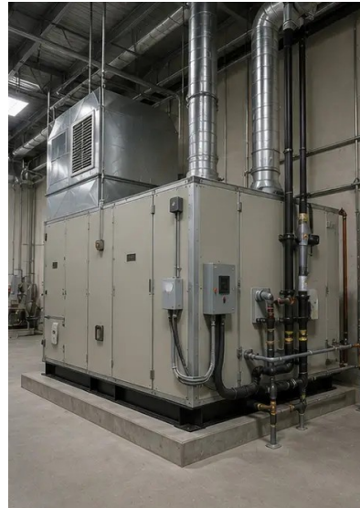
Foto nr.14. Udstyrsinstallation afsluttet