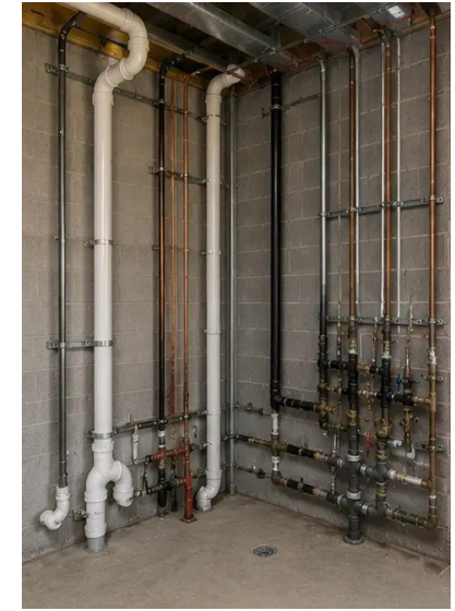
Foto nr.12. VVS-installation afsluttet