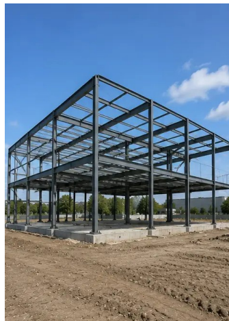
Foto nr.8. Bærende konstruktion afsluttet i henhold til tidsplan