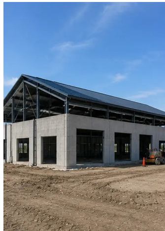
Foto nr.10. Tagkonstruktion afsluttet