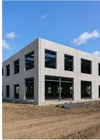
Foto nr.9. Bærende konstruktion afsluttet i henhold til tidsplan