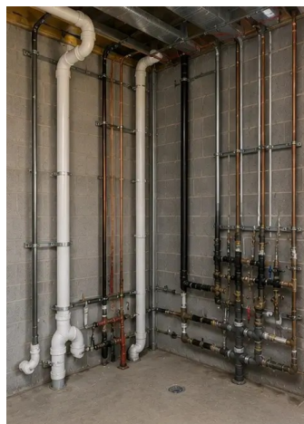
Foto nr.12. VVS-installation afsluttet