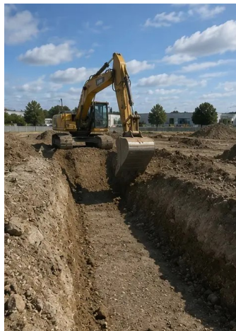
Foto nr.4. Indledende udgravningsarbejde afsluttet