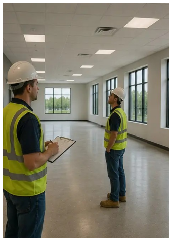
Foto nr.15. Afsluttende projektinspektion gennemført