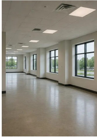
Foto nr.13. Indvendigt afslutningsarbejde i gang