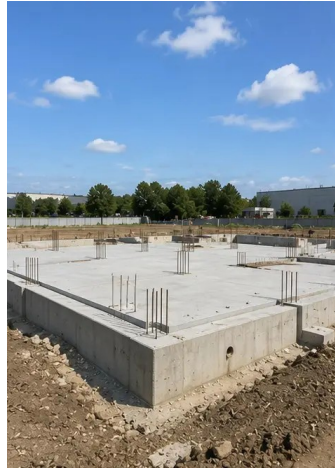
Foto nr.5. Fundamentkonstruktion afsluttet