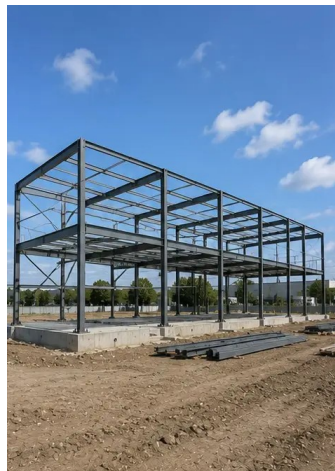
Foto nr.7. Opførelse af bærende konstruktion i gang