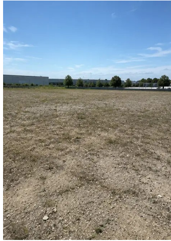
Foto nr.1. Projektsted før arbejdets påbegyndelse