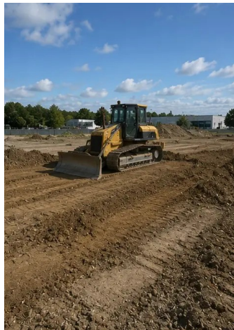
Foto nr.2. Forberedende aktiviteter på pladsen i gang