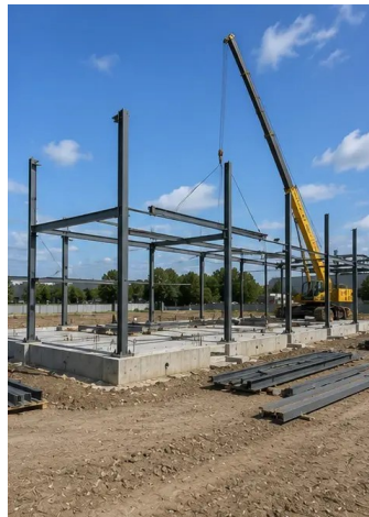
Foto nr.6. Montering af bærende konstruktion påbegyndt