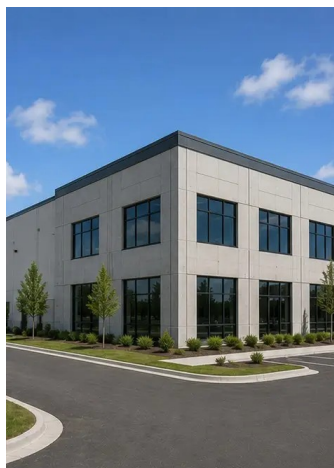
Foto nr.16. Afsluttet projekt klar til drift