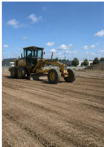
Foto nr.3. Rydning og planering af terræn afsluttet