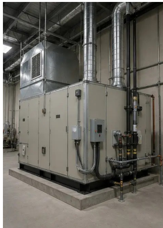
Foto nr.14. Udstyrsinstallation afsluttet