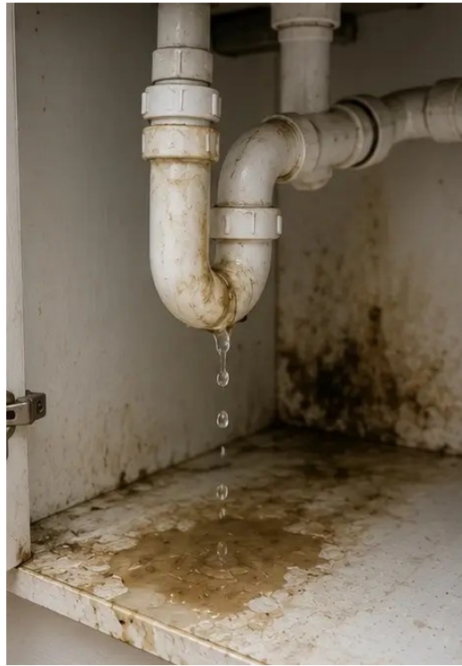
Fotografie č. 11 Poškození únikem vody z instalace zdokumentováno