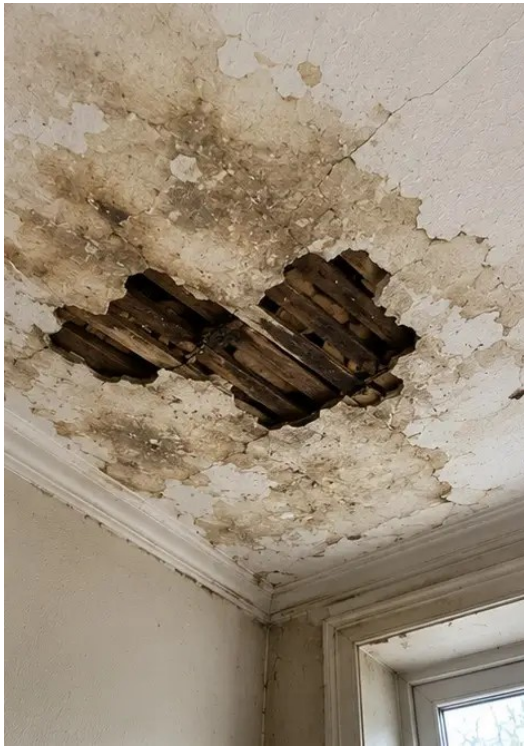
Fotografie č. 10 Poškození stropu identifikováno a zaznamenáno