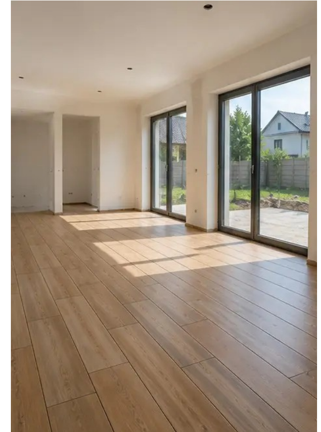
Fotografie č. 12 Pokládka podlah dokončena dle specifikací projektu