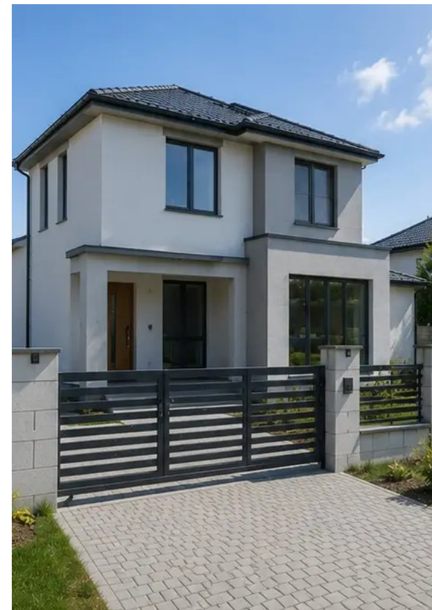
Fotografie č. 15 Dokončený exteriér budovy po výstavbě