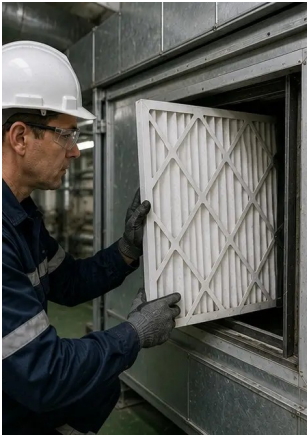
ফটো নং7. এয়ার ফিল্টার প্রতিস্থাপন সমাপ্ত