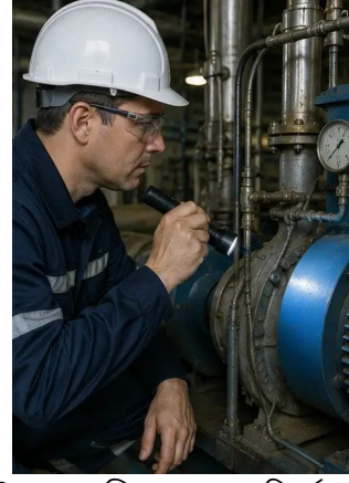
ফটো নং2. যান্ত্রিক সরঞ্জাম পরিদর্শন সমাপ্ত