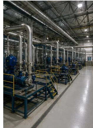
ফটো নং16. রক্ষণাবেক্ষণ কাজ শেষ হওয়ার পরে সুবিধার সাধারণ পর্যালোচনা