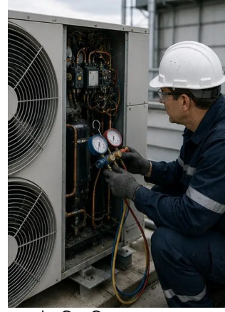
ফটো নং6. এইচভিএসি সরঞ্জামের অবস্থা নথিভুক্ত