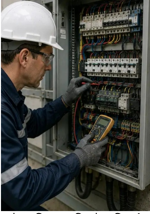
ফটো নং5. বৈদ্যুতিক ক্যাবিনেট পরিদর্শন সম্পাদিত