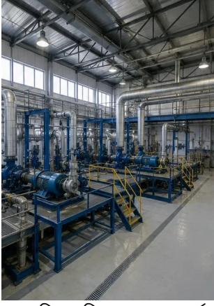
ফটো নং1. শিল্প সুবিধার সাধারণ পর্যালোচনা