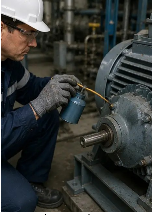
ফটো নং11. সরঞ্জামের উপাদানে তৈলাক্তকরণ কাজ সম্পাদিত