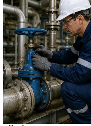
ফটো নং10. পরিদর্শনের সময় মূল্যায়নকৃত ভালভের অবস্থা