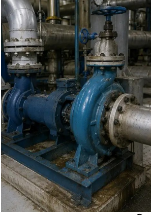
ফটো নং3. রক্ষণাবেক্ষণের সময় মূল্যায়নকৃত শিল্প পাম্পের অবস্থা