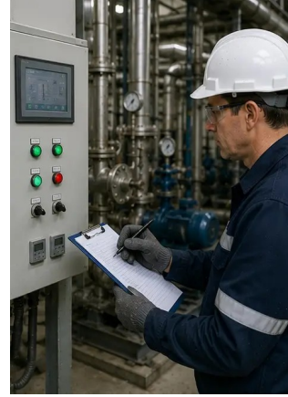
ফটো নং14. চূড়ান্ত রক্ষণাবেক্ষণ যাচাই সম্পাদিত