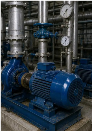
ফটো নং15. রক্ষণাবেক্ষণের পরে সরঞ্জাম স্বাভাবিকভাবে কাজ করছে