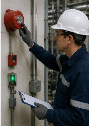
ফটো নং13. নিরাপত্তা সিস্টেম পরিদর্শন সমাপ্ত