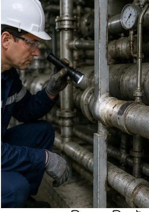
ফটো নং9. রক্ষণাবেক্ষণ সময়সূচী অনুযায়ী পাইপ পরিদর্শন সমাপ্ত