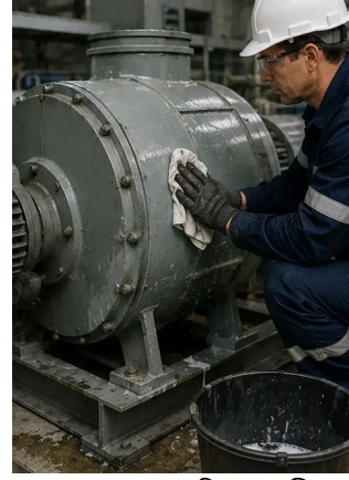
ফটো নং12. সরঞ্জাম পরিষ্কার প্রক্রিয়া সমাপ্ত