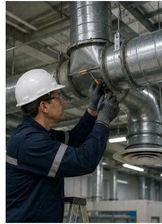
ফটো নং8. ভেন্টিলেশন সিস্টেম রক্ষণাবেক্ষণ সমাপ্ত