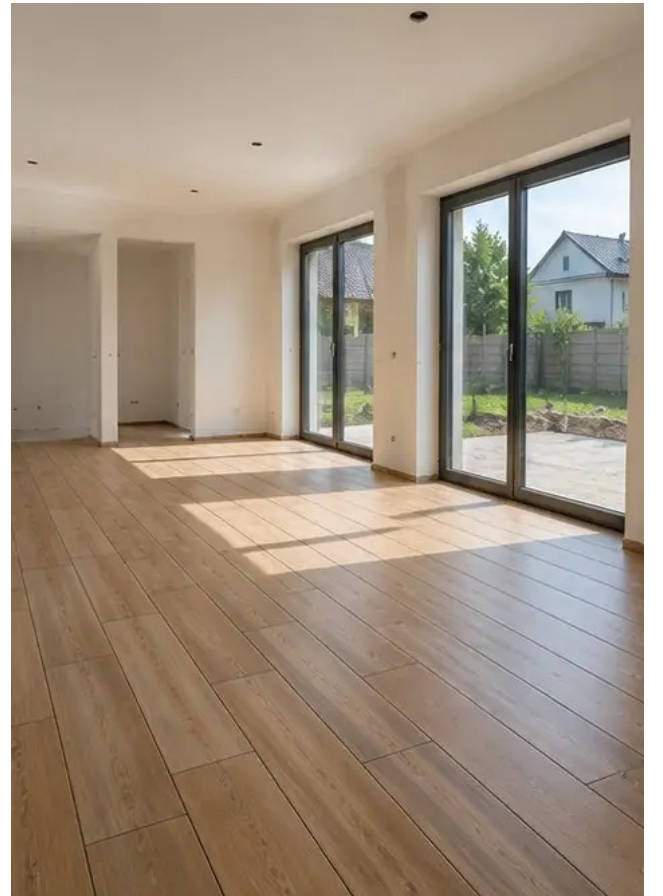
ফটো নং12 প্রকল্পের স্পেসিফিকেশন অনুযায়ী ফ্লোরিং ইনস্টলেশন সমাপ্ত