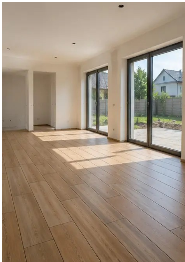
Снимка №12 Полагане на подови настилки завършено съгласно спецификациите на проекта