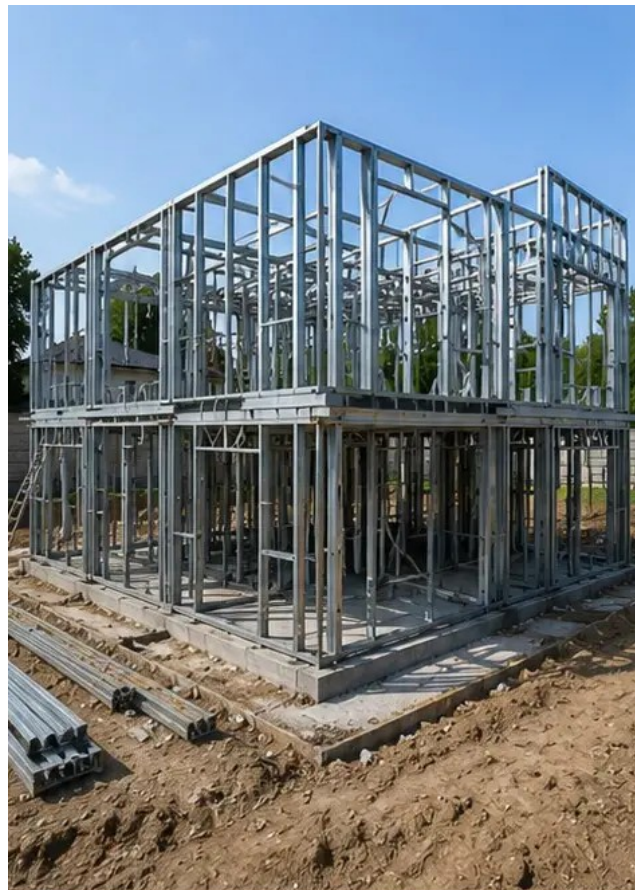
Снимка №6 Монтаж на конструктивна рамка в ход