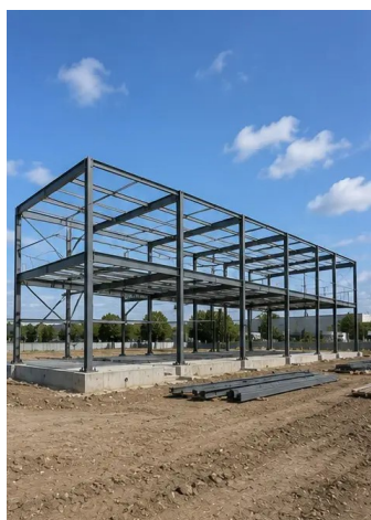
Снимка №7. Изграждане на конструктивната рамка в ход