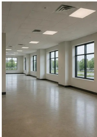
Снимка №13. Вътрешни довършителни работи в ход