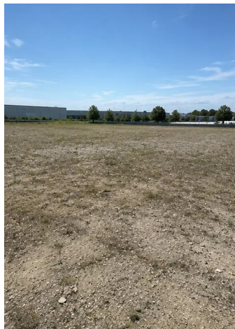
Снимка №1. Площадка на проекта преди започване на работа