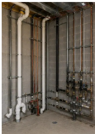
Снимка №12. Монтаж на водопроводни системи завършен