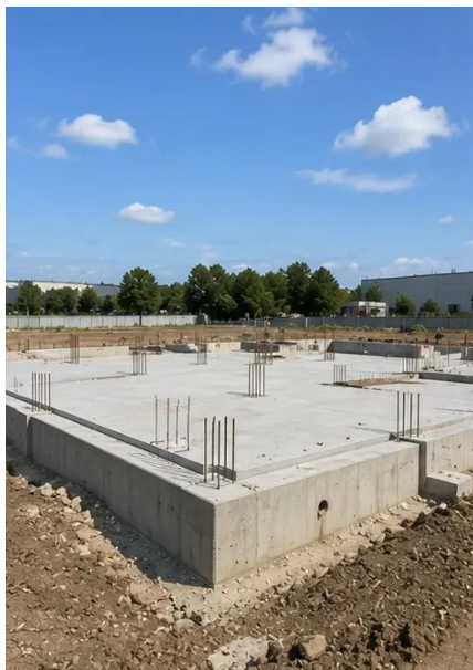
Снимка №5. Изграждане на основи завършено