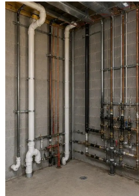
Снимка №12. Монтаж на водопроводни системи завършен