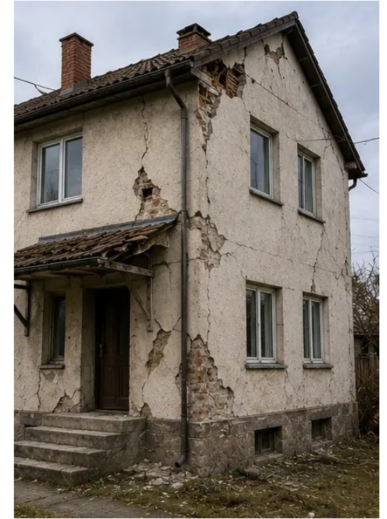
Снимка №15 Общ преглед на множество места с щети