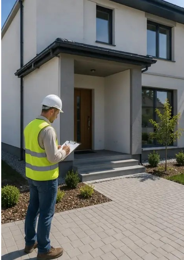
صورة رقم 13 الفحص النهائي لأعمال البناء المكتملة