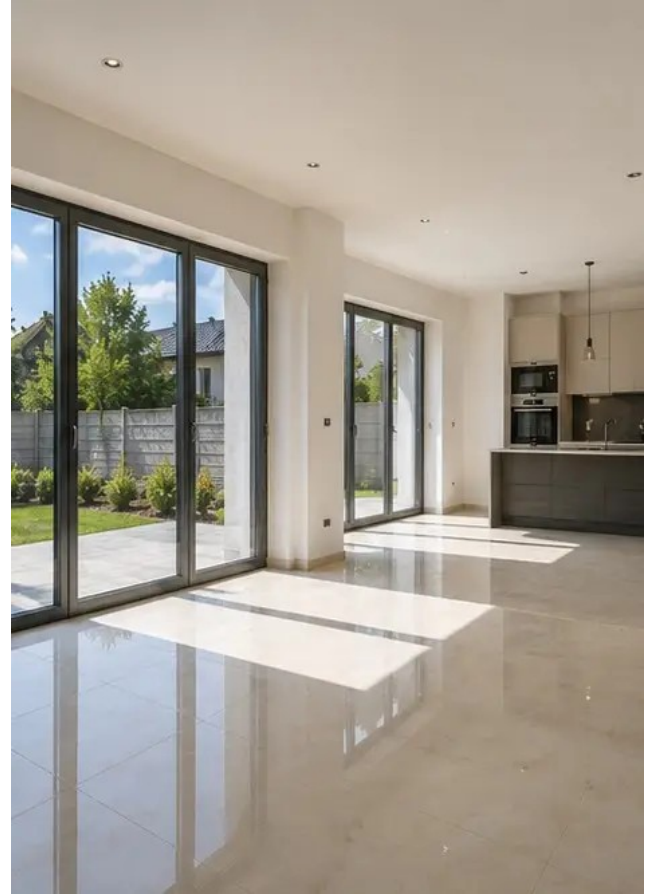
صورة رقم 16 التصميم الداخلي للمبنى جاهز للتشغيل