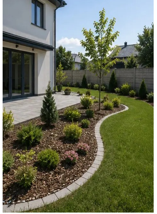
صورة رقم 14 تنسيق الموقع الخارجي مكتمل حول المنشأة