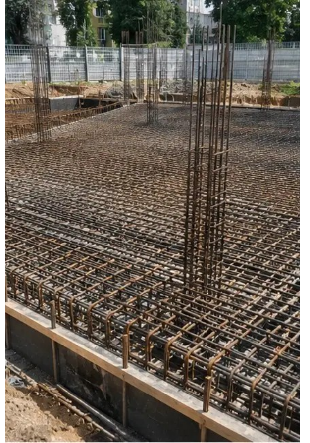
صورة رقم 4 تركيب حديد التسليح مكتمل قبل صب الخرسانة